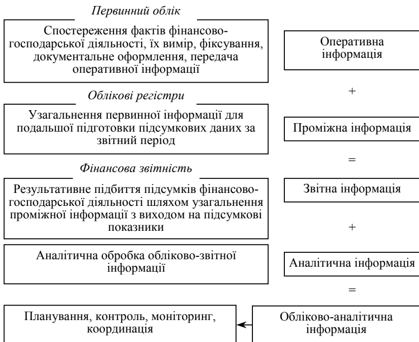
Рис. 1. Схема формування обліково-аналітичної інформації

подарювання [6, с. 316]. Затребуване обліково-аналітичне забезпечення, що вміщує в себе результат багатоступеневої обробки документально підтверджених фактів господарської діяльності підприємства. Схема процесу підготовки обліково-аналітичної інформації передбачає поступовий перехід первинних даних в аналітичні з різним рівнем узагальнення та деталізації (рис. 1).