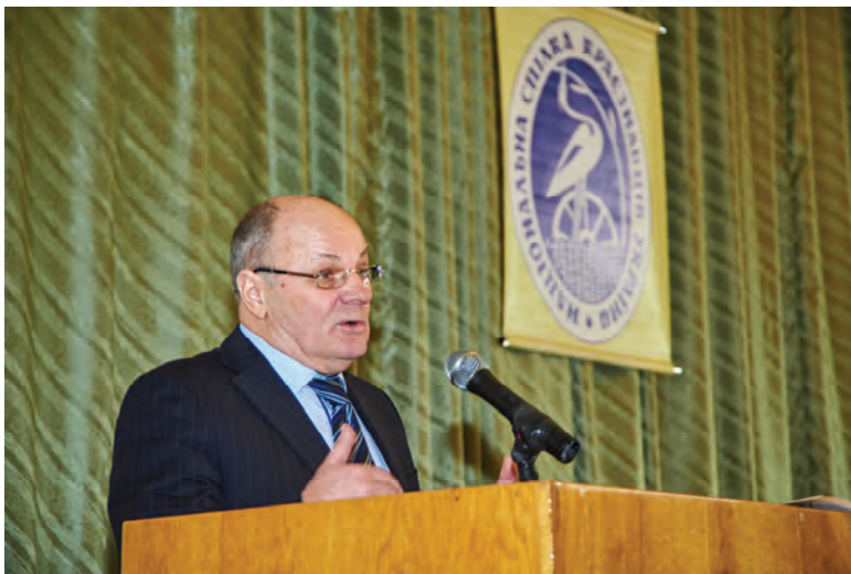
Виступ Голови Національної спілки краєзнавців України, члена-кореспондента НАН України Реєнта О.П.