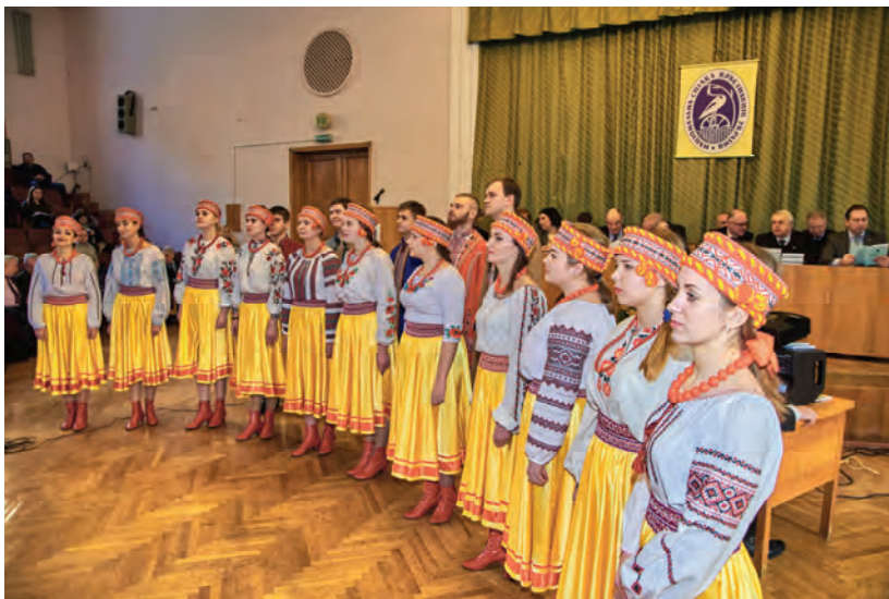
Ансамбль української пісні «Золоте Перевесло» Центру культури і мистецтв Національного педагогічного університету ім. М.П. Драгоманова вітає делегатів з'їзду