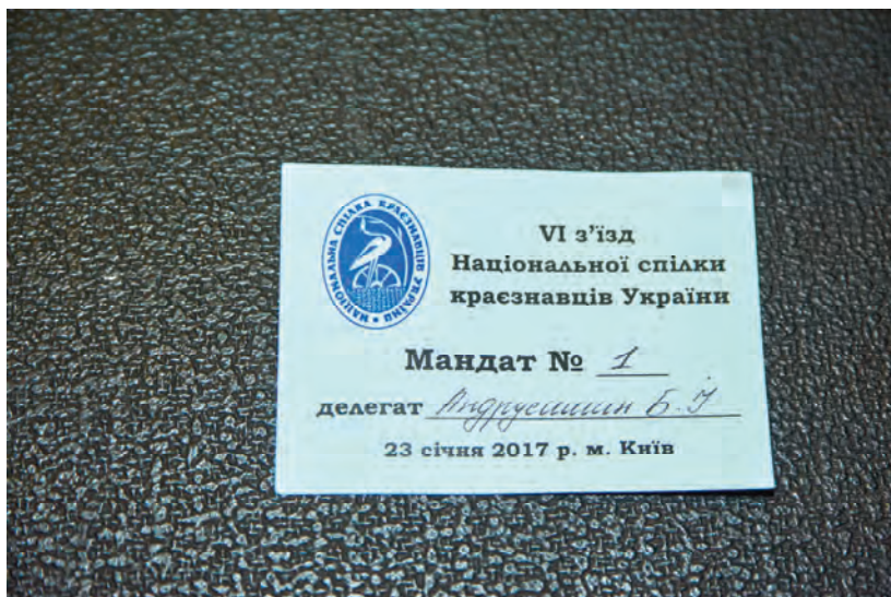
Мандат делегата VI з'їзду Національної спілки краєзнавців України