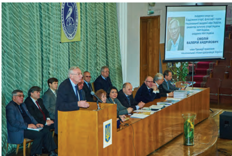
Виступ директора Інституту історії України НАН України, академіка-секретаря Відділення історії, філософії і права НАН України, члена Президії НСКУ, академіка НАН України Смолія В.А.