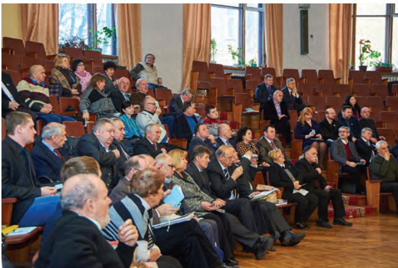
В залі засідань