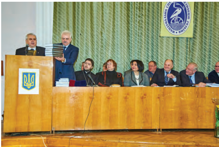
Вітання делегатам з'їзду від ректора Національного педагогічного університету імені М.П. Драгоманова, члена-кореспондента НАН України, академіка НАПН України Андрущенко В.П.