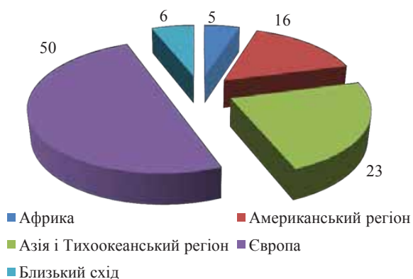
Рис. 1. Регіональна структура міжнародного туристичного ринку у 2014 р., %

Число міжнародних туристських прибуттів в Європу (самий відвідуваний регіон світу) збільшилася на 3%. Це є досить позитивним результатом на тлі нинішньої економічної ситуації після високого результату 2014 року (+6%). Загальна кількість прибуттів досягла 535 млн, що на 17 млн більше, ніж у 2014 році. Серед субрегіонів кращими туристичними напрямками стали країни Центральної та Східної Європи (+8%), за якими слідує Західна Європа (+3%). Туристичні напрями північно-середземноморської Європи (+2%) зміцнили свої відмінні результати 2014 року та повернулися до своїх звичайних темпів зростання [5].