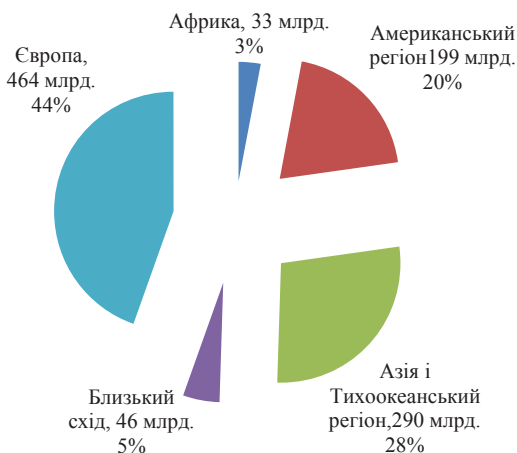
Рис. 2. Надходження від міжнародного туризму у 2014 р., млрд дол. США

потоків (рис. 2). Провідними міжнародними туристичними ринками (за обсягами доходів) на сьогодні залишаються розвинені країни Європи, Американського та Азіатсько-Тихоокеанського регіонів [3; 4; 5].