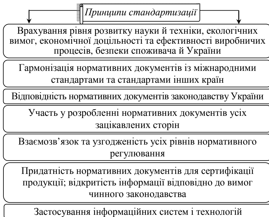
Рис. 1. Принципи стандартизації

Поліпшення якості та підвищення конкурентоспроможності товарів (процесів, робіт, послуг) можливе тільки на основі стандартизації. Вона дозволяє регламентувати вимоги до якості продукції, більш ефективно вирішувати проблеми спеціалізації, визначати раціональні способи виробництва продукції і переробки сировини, здійснювати управління якістю товарів у виробництві та сфері обігу [4, с. 11].