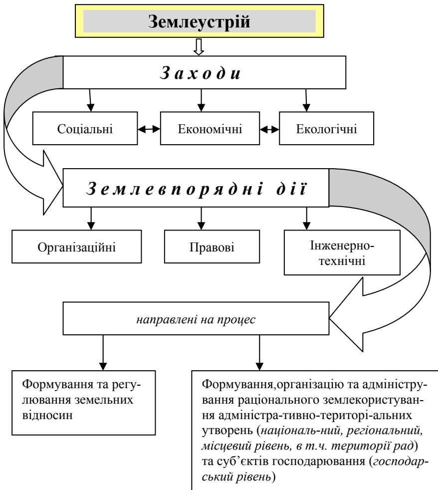
Рис. 1. Логічно-сміслова схема сутності сучасного землеустрою

Його сутність можна виразити логічно-сміисловою схемою приведеною на рис. 1.