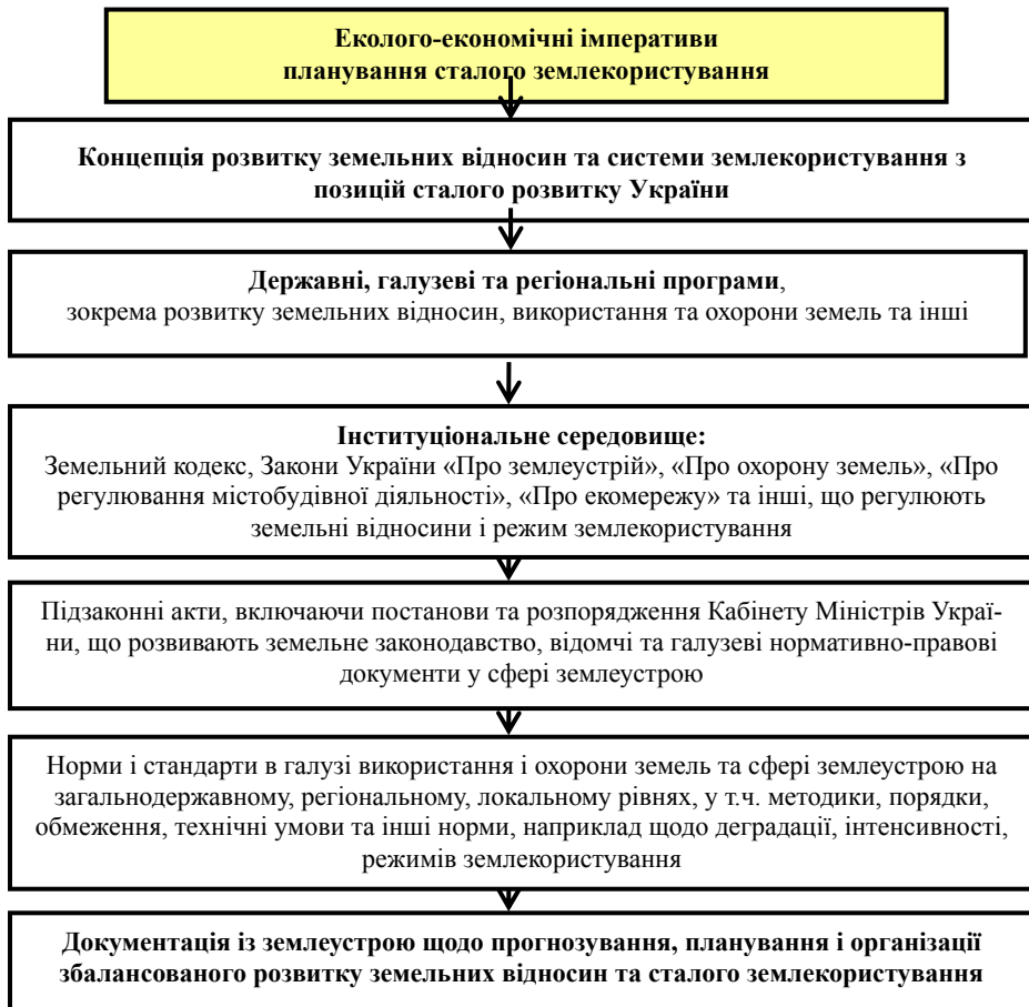
Рис. 3. Логічно-смысловая модель розвитку системи сучасного землеустрою, що базується на основі процесу узгодження і реалізації еколого-економічних імперативів планування збалансованого землекористування

логічної збалансованості. Без такої системи земельний устрій країни формується неузгоджено в територіальному та факторному напрямках. У зв'язку з переважанням окремих формальних та неформальних інститутів неможливе землекористування в контексті сталого розвитку.