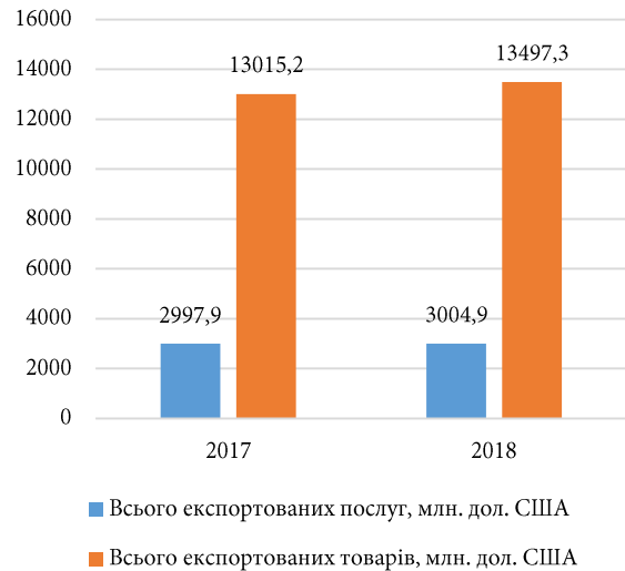
Рис. 1. Експорт товарів та послуг вітчизняних підприємств до країн ЄС з 2017 по 2018рр.

Згідно зі статистичними даними експорт товарів та послуг до країн ЄС постійно зростає. Така динаміка обумовлена інтенсифікацією інтеграційних процесів, що відбуваються в країні.