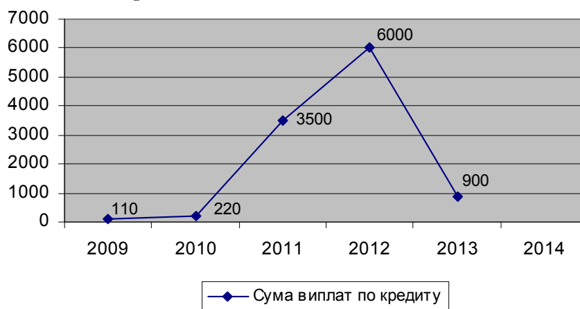
Рис. 1. Сума виплат по кредиту (2010-2014 рр.)

Як видно з табл. 2, кредити від МВФ є порівняно дешевим, оскільки передбачає виплату відсотків у розмірі близько 2% річних від загальної суми боргу. Сума випала по кредиту висвітлена на рис. 1.