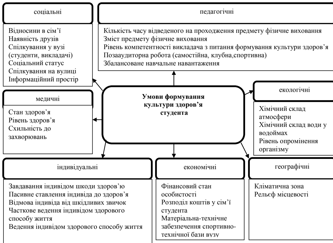
Рис.1. Умови формування культури здоров'я студента

Проаналізувавши інформацію отриману на основі опрацювання теоретичних джерел ми визначили основні необхідні умови формування культури здоров'я студентської молоді, ними є: соціальні, педагогічні, економічні, медичні, індивідуальні, екологічні, географічні (рис. 1).