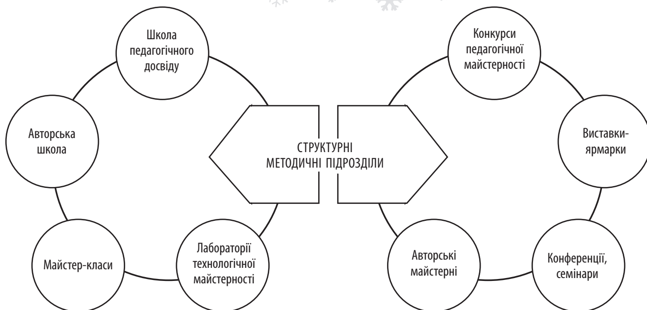
■ Рис. 2. Традиційні форми поширення, упровадження, використання, освоєння досвіду

здійснюють під керівництвом науковців окружні (базові) школи педагогічного досвіду, авторські творчі майстерні вчителів, лабораторії (школи) технологічної майстерності тощо.