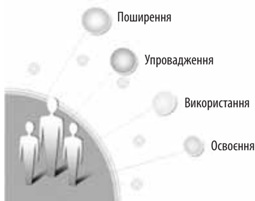
■ Рис. 1. Педагогічний досвід: розрізняймо терміни

ефективності; повсякденне та наполегливе навчання вчителя застосування сучасних методів, форм, прийомів; контроль збоку директорів, заступників за фактичним упровадженням педагогічного досвіду в практику роботи вчителя; визначення ефективності нових прийомів і методів праці за основними показниками — рівнем навчальних досягнень учнів, сформованими компетенціями, рівнем вихованості. Це система діяльності, спрямована на перетворення та вдосконалення практики.