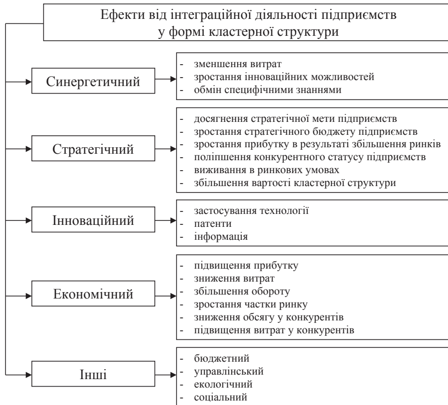
Рис. 1. Класифікація сфер ефектів від застосування регіонально-кластерного підходу до управління інноваційним розвитком

- можливість більш ефективного та раціонального використання наявних