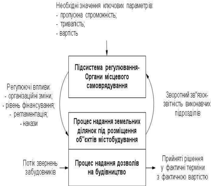
Рис.1 – Система регулювання процесів містобудівельної діяльності органів місцевого самоврядування України

місцевого самоврядування України наведена на рис.1.