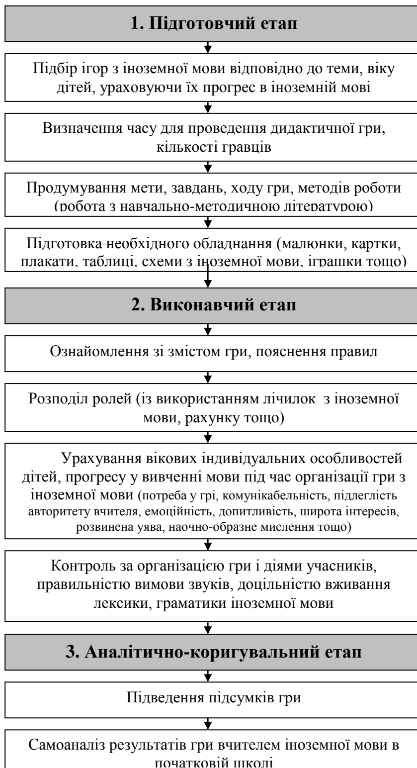
Рис. 2. Етапи організації дидактичних ігор для вивчення іноземної мови в початковій школі

1. Підготовчий етап передбачає визначення вчителем іноземної мови