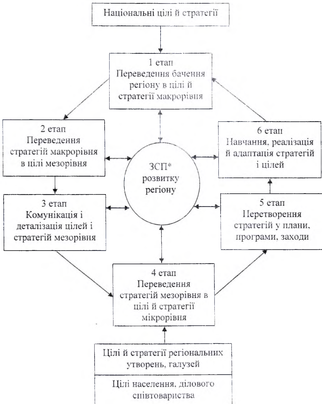
Рис. 2. Система формування й реалізації стратегічних цілей розвитку регіону ЗСП* – збалансована система показників.

Для реалізації стратегічних цілей необхідно трансформувати стратегії в стратегічні плани, програми, заходи (п'ятий етап). На шостому етапі здійснюється реалізація й адаптація цілей і стратегій шляхом виконання і коректування стратегічних програм, заходів. Усі етапи й рівні формування стратегічних цілей виконуються в системі збалансованих показників (ЗСП). Відповідно до концепції ЗСП стратегічні цілі, їх індикатори, цільові значення індикаторів і стратегічні заходи взаємозв'язані [7, с.153].