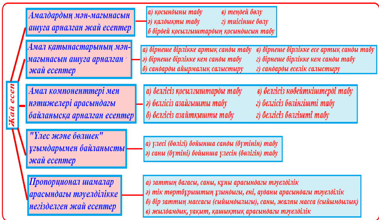
Сурет 1 – Есептің түрлері.

Яғни 2-3 баған түрінде беріледі, балаларға тиімді жол ретінде және уақыт үнемдеу үшін әрқатар бойынша бөліп беріп мысалды орындатады. Кейде мысалдар ауызша орындалуы мүмкін. Оқушылардың мысал мен есептің айырмашылығын 1-сыныптан бастап түсіндіре білу қажет.