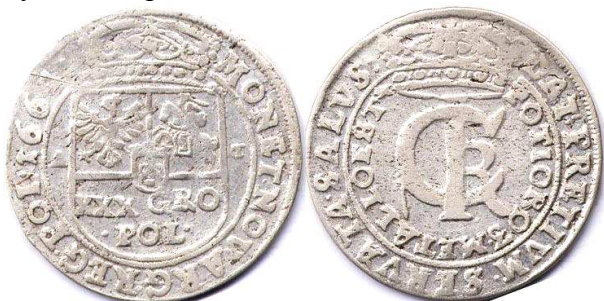
Тимф (злотівка), Ян II Казимир, 1664 р.

Монети повинні були мати масу 6,729 г і діаметр 31 мм, у тому числі 3,364 г чистого срібла, що з огляду на вартість срібла на ринку становило лише 40 % номінальної вартості. Реальна вартість злотівки не перевищувала 12 грошів. Це зазначалося в легенді монети: «DAT: PRETIUM: SERVATA: SALUS / POTIORQ3. METALLO. EST» – «БАЖАННЯ ВРЯТУВАТИ ДЕРЖАВУ ДОРОЖЧЕ, НІЖ ВАРТІСТЬ МЕТАЛУ». Їх емісія здійснювалась у Львові, Бидгощі та Кракові. Від прізвища автора проекту випуску білонних злотівок Андрія Тимфа ця монета отримала народну назву «тимф». Усього їх було відкарбовано близько 11 млн 250 тис. шт. 21 .