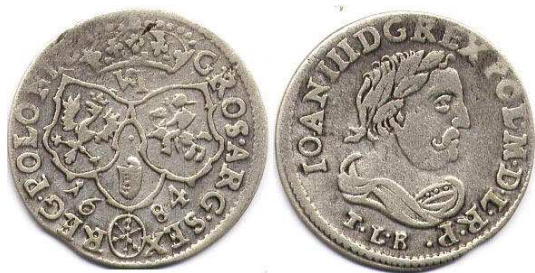
Шостак, Ян III Собєський, 1684 р.

У перші роки правління Августа II (1697–1733 рр.), який був одночасно герцогом Саксонії, монетно-грошові стосунки на землях польсько-литовської держави перебували у стані глибокої кризи. Більшість монетарень не функціонувала, грошовий ринок країни був наповнений неповновартісною вітчизняною та іноземною розмінною монетою. Ситуація ще більше погіршилась після вступу Речі Посполитої до антишведської коаліції і початку Північної війни (1700–1721 рр.). Через дестабілізацію політичного життя, окупацію країни військами Карла XII та ряд інших причин уряд не міг розпочати монетну емісію на власній території. Виробництво монет, згідно з польською монетною стопою, велося на саксонських монетних дворах 27 .