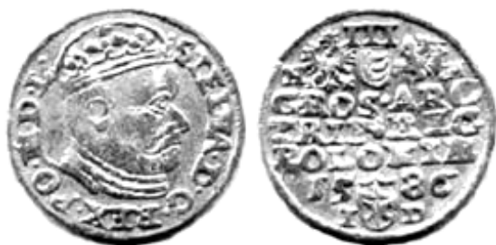
Трояк, Стефан Баторій, 1586 р.

відкрито познанський монетний двір. Тут емітували лише соліди та трояки, а також незначну кількість дукатів у 1586 р. 3