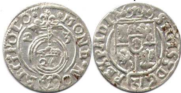
Півторак, Сигізмунд III, 1623 р.

Від 1614 р. розпочалася емісія ще одного нового номіналу – півторака ( \frac{3}{2} гроша). Зразком для нього стали німецькі апфельгрошени, або драйпелькери, про що свідчить вміщена на їх аверсі цифра \frac{1}{24} (в Німеччині з 24 таких монет складався один лічильний талер). З краківської гривни срібла карбували 128 півтораків. У кожному з них містилось 0,739 г чистого срібла 9 .