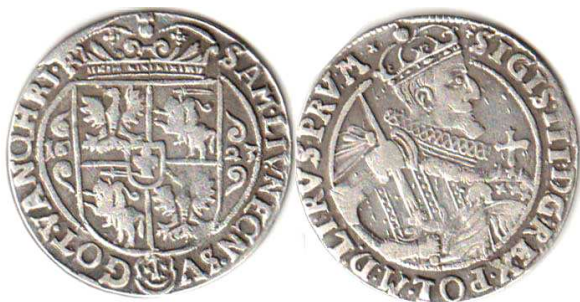
Орт, Сигізмунд III, 1623 р.

Коронні орти вперше було відкарбовано в 1618 р. З вагової гривни срібла виготовляли 31 монету цього номіналу, кожна з яких містила 5,222 г чистого металу. Масова емісія їх розпочалася лише в 1621 р. на бидгощському монетному дворі за новою монетною ординацією. Вміст чистого срібла в цьому номіналі знову зменшився до 4,955 г. Його вартість тоді становила 21 коронний гріш 8 .