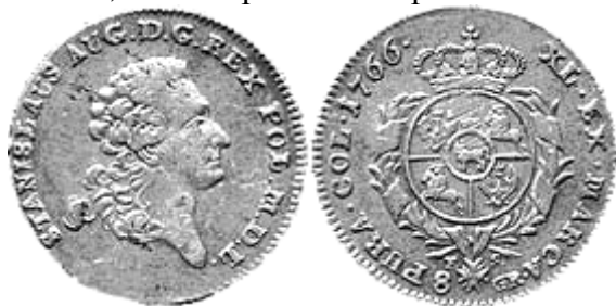
2 злоті (8 грош), Станіслав Август Понятовський, 1766 р.

За Станіслава Августа Понятовського (1764–1795 рр.) уряду вдалося впорядкувати грошове господарство країни. Карбована у великій кількості, згідно з реформою 1766 р., високоякісна польська монета швидко посіла панівне становище на ринку. З міді в Кракові (у 1765–1768 рр.) та Варшаві (у 1765–1795 рр.) випускалися шеляги, півгроші, гроші та трояки. Срібні номінали, які карбувалися у варшавській монетарні, представлені монетами вартістю 6 та 10 мідних грошів, 1 та 2 срібних гроші, 1 та 2 злотих, \frac{1}{2} талера та 1 талер.