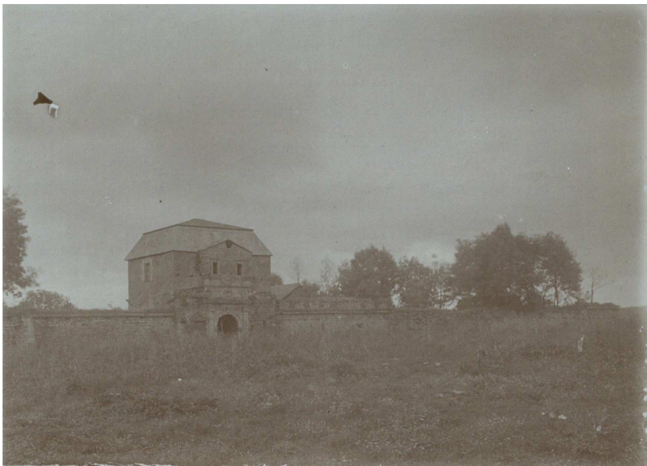
Фото 1. Замок у Чернелиці 1921 р. ЛННБ, Відділ рукописів, ф.26, спр. УК-47/16, арк. 146.

У матеріалах Відділу охорони пам'яток культури та мистецтва є також 18 фотографій, що відображають архітектурні споруди в Чернелиці – замок та римо-католицький костел Св. Антонія з Падуї, споруджений у XVII ст. Фотографії фортеці вміщені в справі УК-47/16. Мова йде про шість знімків (арк. 144–149), датованих 1921 роком 7 . Ще одне зображення замку знаходиться, очевидно помилково, в сусідній справі 8 . Усі фотографії замку виконано – 12 вересня 1921 р. 9 . Цим днем датуються також знімки костелу, хоча справа, в якій вони знаходяться, хронологічно відноситься до 1922 р. 10 . Одна з фотографій, яка відображає внутрішню частину святині, датується 22 вересня 1921 р. 11 . Швидше за все, усі фото чернелицьких пам'яток виконані однією людиною, прізвище якої не вдалося встановити. Не відомо, чи згадана особа спеціально прибула зі Львова до Чернелиці, чи Консерваторське Бюро скористалося послугами фотографів з Городенки або Коломиї. Можливо, знімки, виконані в 1921 р., були включені до матеріалів Відділу охорони пам'яток та мистецтва пізніше. З'ясування цього питання вимагає подальших досліджень.