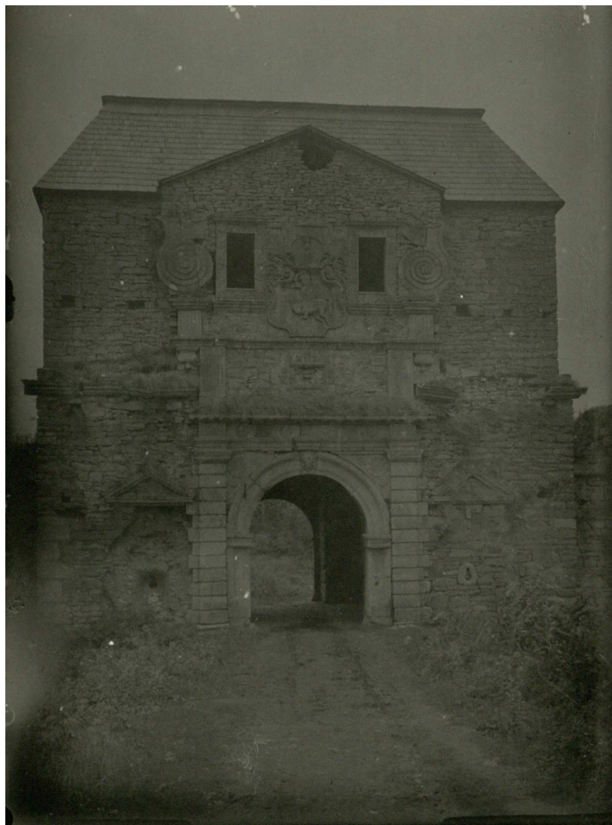
Фото 2. Надбрамна вежа із західної сторони.

Аркуші 145 та 146 являють собою копії згаданої фотографії. Перша з них є ідентичною, а друга відрізняється дещо більшим форматом (13 x 9,5 см) і темнішими кольорами 14 .