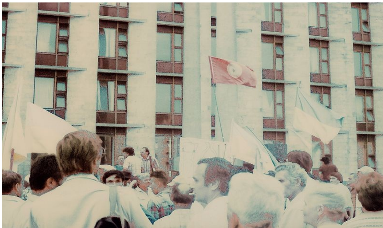
Мітинг НРУ на честь підняття Українського національного прапора над Київською міською радою (м. Київ, 24 липня 1990 р.)