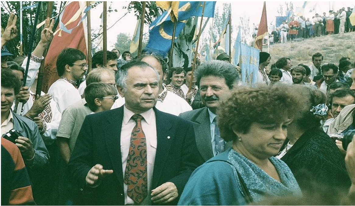
В. Чорновіл під час свята «Козацької слави», присвяченого 500-річчю Запорізького козацтва (серпень 1990 р.)