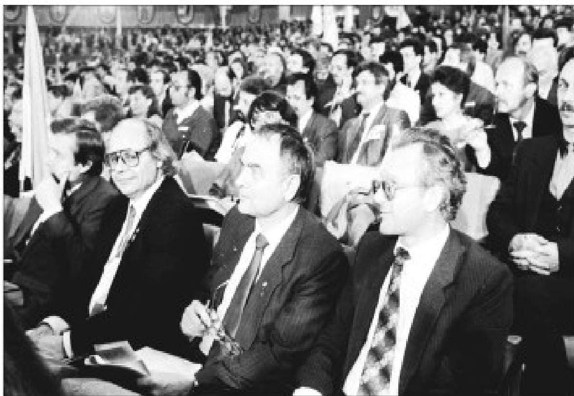
Полтавська делегація Першого з'їзду НРУ за перебудову (м. Київ, 10 вересня 1989 р.)