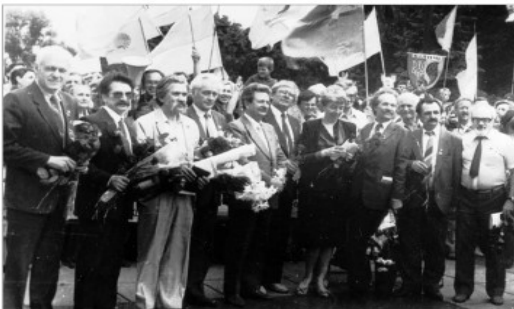
Кияни і гості столиці під час масової акції «Ланцюга єдності», присвяченої 71-й річниці возз'єднання ЗУНР і УНР в єдину суверенну державу (22 січня 1990 р.)