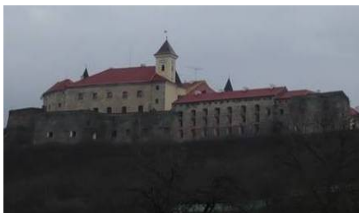
Замок Паланок XIV–XVI ст. (м. Мукачеве Закарпатської обл.)