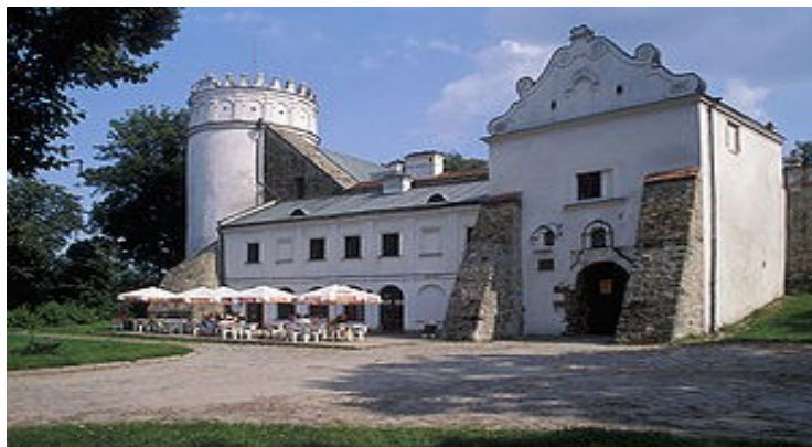
Перемишльський замок XIV ст. (м. Перемишль, Підкарпатське воєводство)