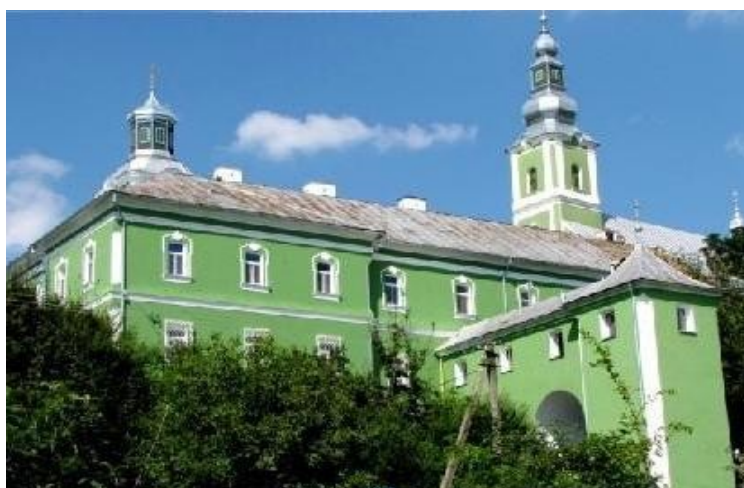
Свято-Миколаївський монастир (м. Мукачеве Закарпатської обл.) Культ.-рел. осередок Закарпаття з кін. XI ст.