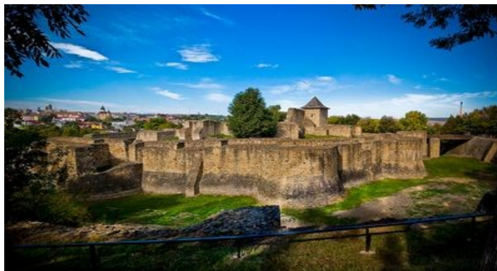
Тронна фортеця XIV ст. (м. Сучава, повіт Сучава)