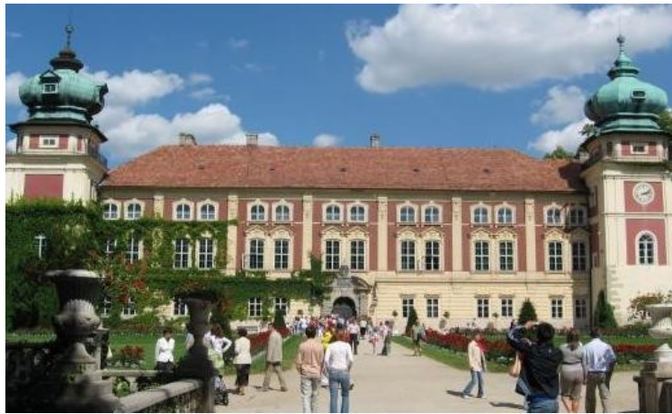
Середньовічна фортеця Ланьцут пер. пол. XVII ст. (м. Ланьцут, Підкарпатське воєводство)