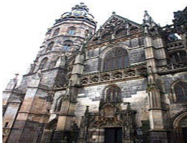
Готичний собор св. Єлизавети (1382–1499 рр.) (м. Кошице, Кошицький край)