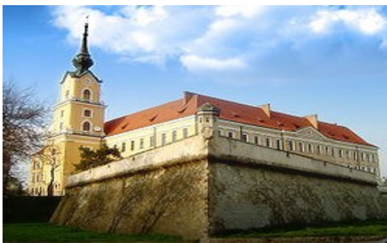
Замок князів Любомирських кін. XVII–XVIII ст. (м. Жешув, Підкарпатське воєводство)