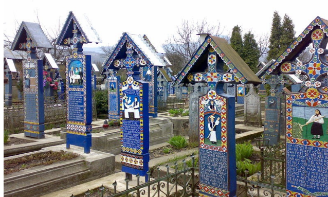
«Веселий цвинтар» (рум. «Cimitirul Vesel») (с. Сепинці, повіт Марамуреш)