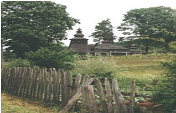
Церква 1770 р. у Міролі (м. Свидник, Пряшівський край)