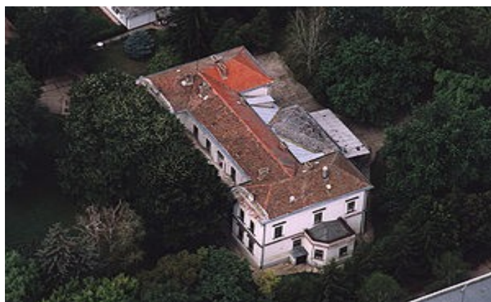
Замок Генчи 1774 р. (м. Балькань, медьє Яс-Надькун-Солнок)