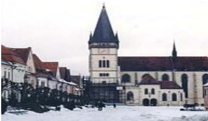
Костел св. Егідія (Ігатія) XV ст. (м. Бардеїв, Пряшівський край)