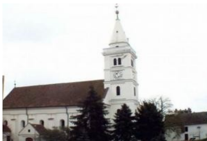
Реформаторська церква XV ст. (м. Хайдусобосло, медьє Хайду-Біхар)