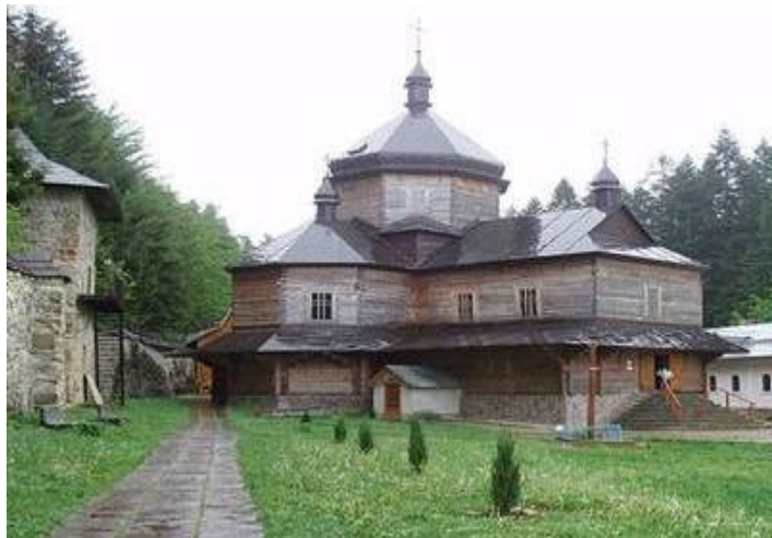
Манявський скит – монастир 1621 р. (біля с. Манява Івано-Франківської обл.)