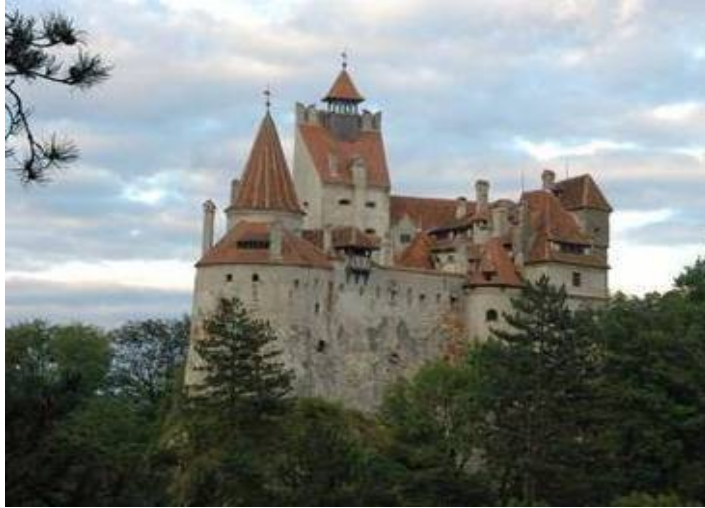
Замок Бран (замок графа Дракули) (с. Бран, повіт Брашов)