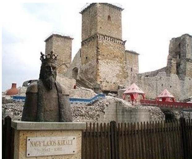
Замок Діошдьор XIII ст. (м. Мішкольц, медьє Боршод-Абауй-Земплен)