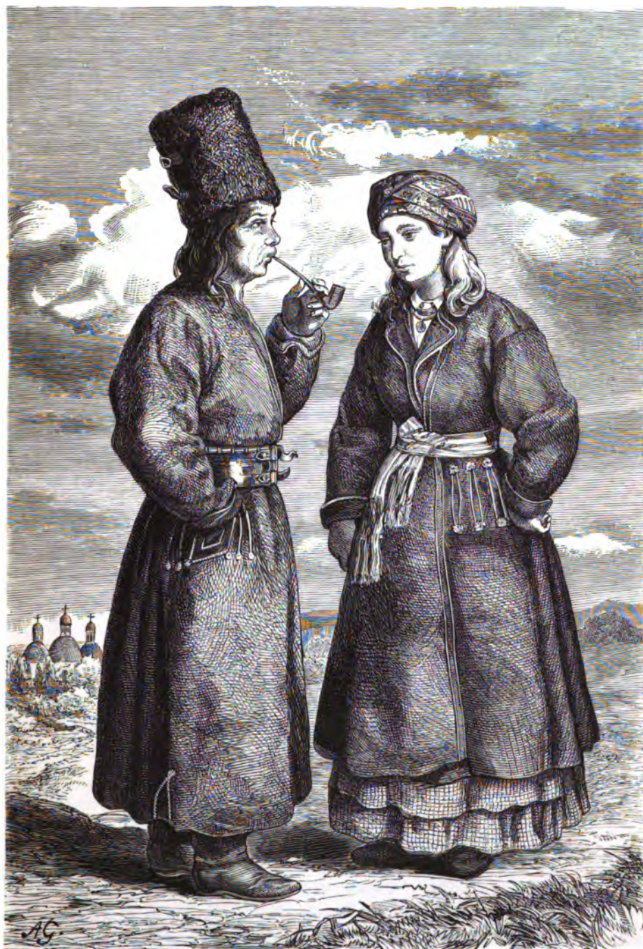
Русскіе крестьяне Золочевского уѣзда села Стрептова въ восточной Галичинѣ.