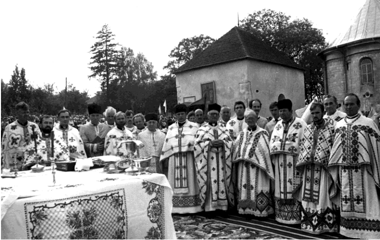
Біля джерел української духовності. Крилос, 26.06.1990 р.