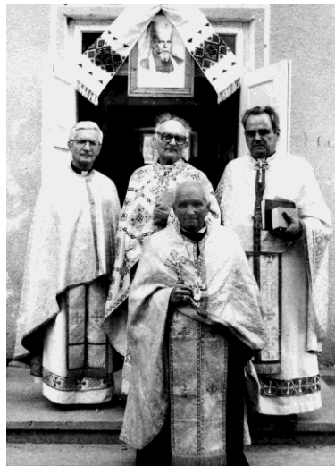
У Зарваниці. Вшанування пам'яті Патріярха Йосифа Сліпого, 19-21.05.1995 р.