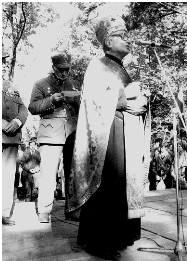
Під час святкування 52 річчя УПА, 15.10.1994 р., м. Івано-Франківськ