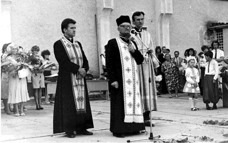
Виступ на I-му дзвонику в СШ №23 м. Івано-Франківська, 1992 р.