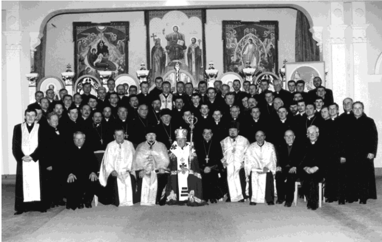
І-ий собор Отців і мирян Івано-Франківської Духовної Академії, 2002 р.