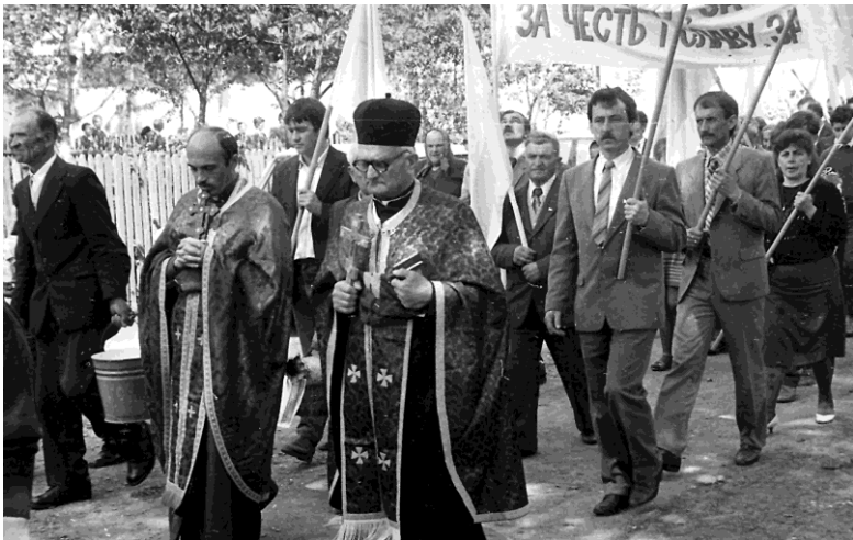
Похід до стрілецьких могил, 1992 р.