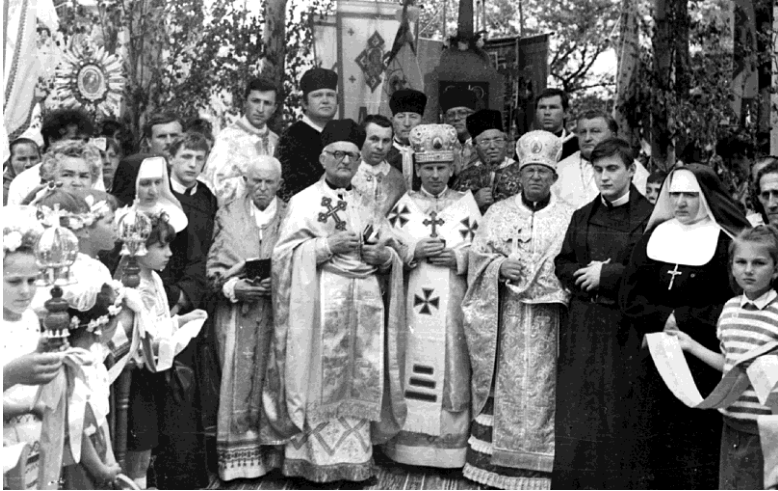
На посвяченні могили. Перегінськ, липень 1990 р.