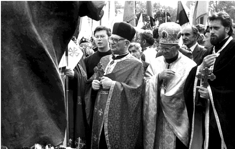
Біля пам'ятника Степана Бандери в Угринові, серпень 1992 р.