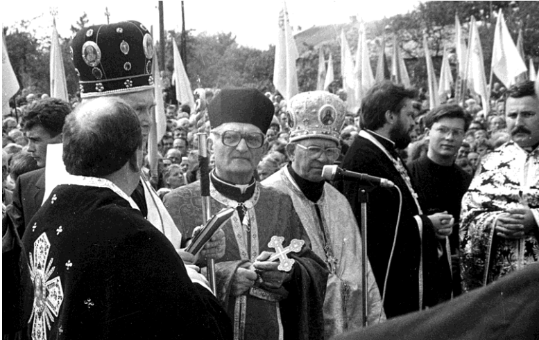
Благословення пам'ятника Степану Бандері, с. Угринів, 1992 р.