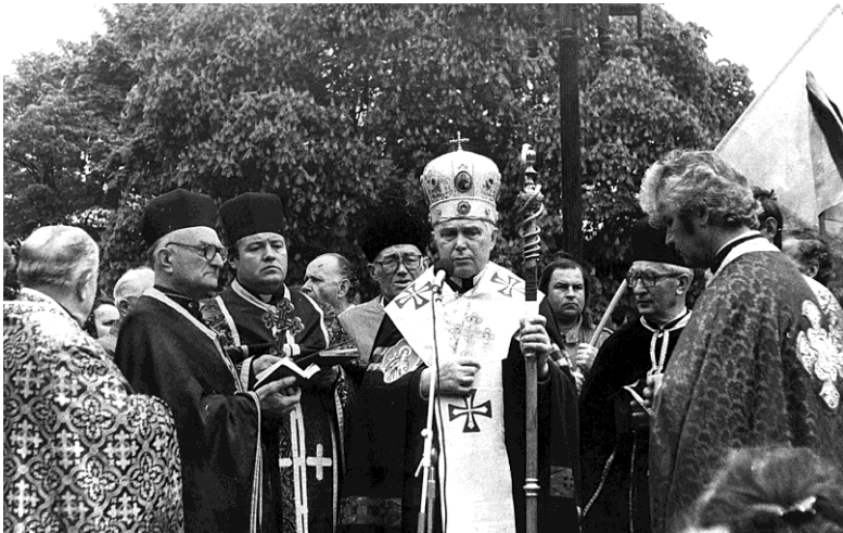
На панахиді, присвяченій жертвам Чорнобиля, 26.04.1990 р.