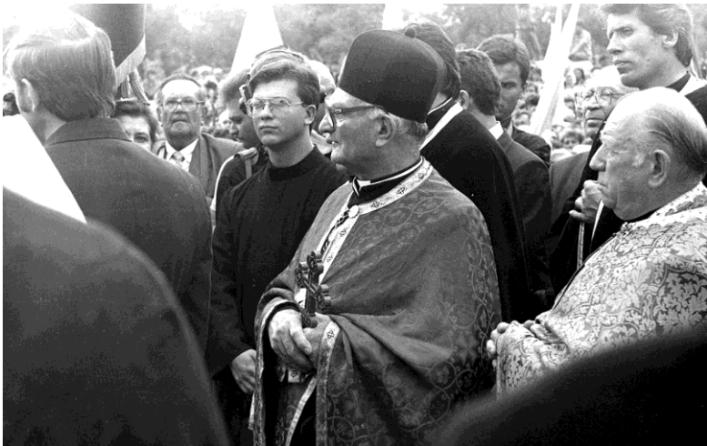
На святі в Угринові, серпень 1992 р.