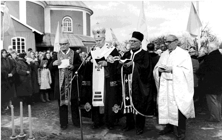
На стрілецьких могилах. с. Кути