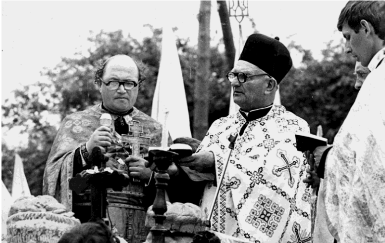
На святі в с. Горохолино Богородчанського р-ну, 1991 р.