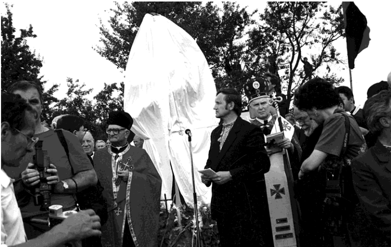
На відкритті пам'ятника Степану Бандері, с. Угринів, 1992 р.