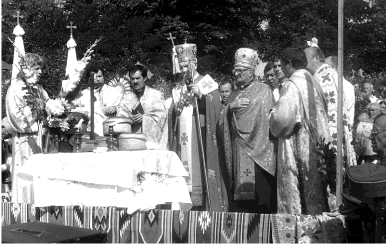
Посвячення могили, с. Росільне, 15.08.1993 р.