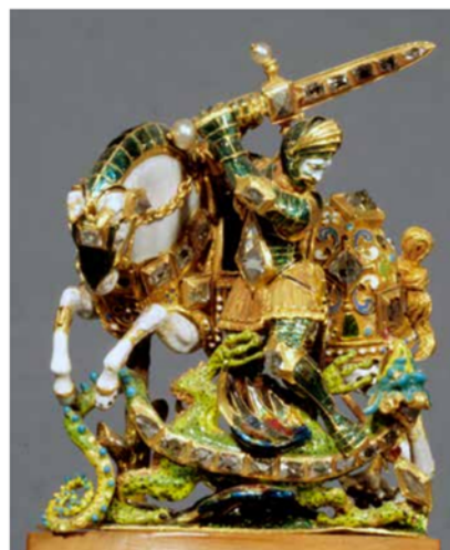
Б. Крістіан IV Денмаркський, 1603, Розенборзький замок. 1.40.