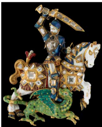
А. Вільям Комптон, 1628–1629. Британський музей, 1980, 0201.2

Таким чином, формування образу короля як водночас лицаря і paterfamilias припадає на правління Джеймса VI & I. Репрезентація лицарських чеснот у портретах Джеймса сприяла утвердженню ідеалів військової влади правителя, духовного лідерства короля та належності його до нобілітету ( noble lineage ). Зроблено висновок про сакральність символіки Ордену як засобу діалогу між особою монарха та підданими (народом). Реконструкція образу на основі зображальних джерел дає змогу виявити, яким сприймали короля сучасники. Моральність і поведінка короля як "батька" всіх англійців ( paterfamilias ) була зразком, авторитетом і задавала фрейм усьому суспільству, адже королівський двір і сім'я сприймалися як модель.