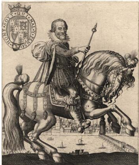
Рис. 2. Король Джеймс I Англії та VI Шотландії, опубліковано Еберхардом Кізером.

Гравюра, початок 17 ст. 7 1/4 in. x 5 in. (184 mm x 126 mm); 8 1/2 in. x 5 3/4 in. (215 mm x 145 mm)