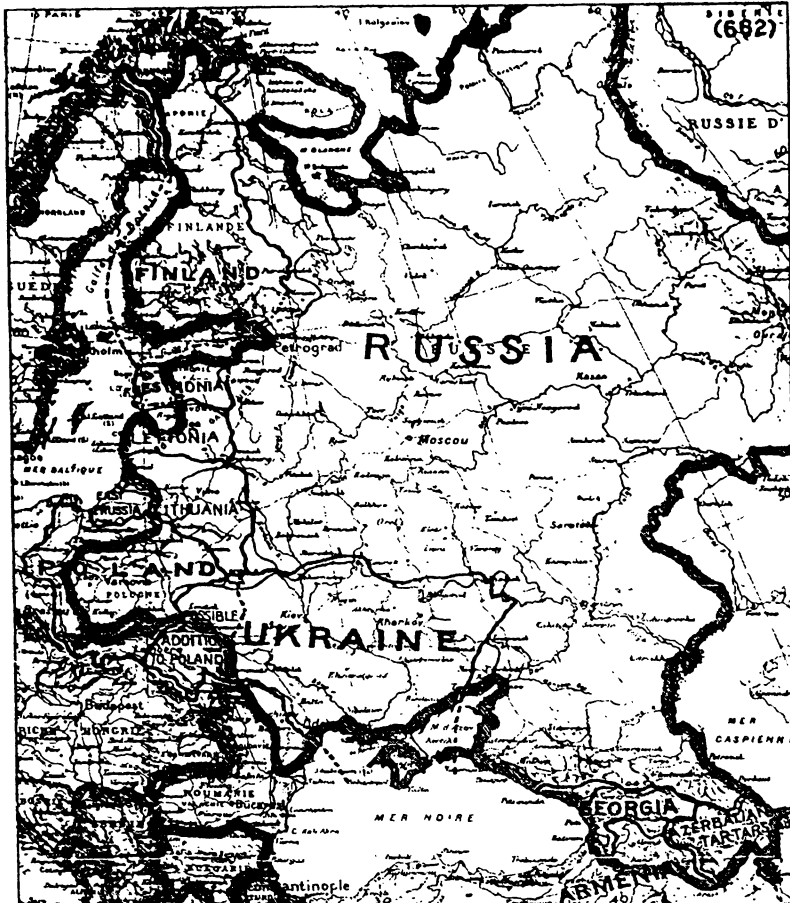
— Linguistic Boundary