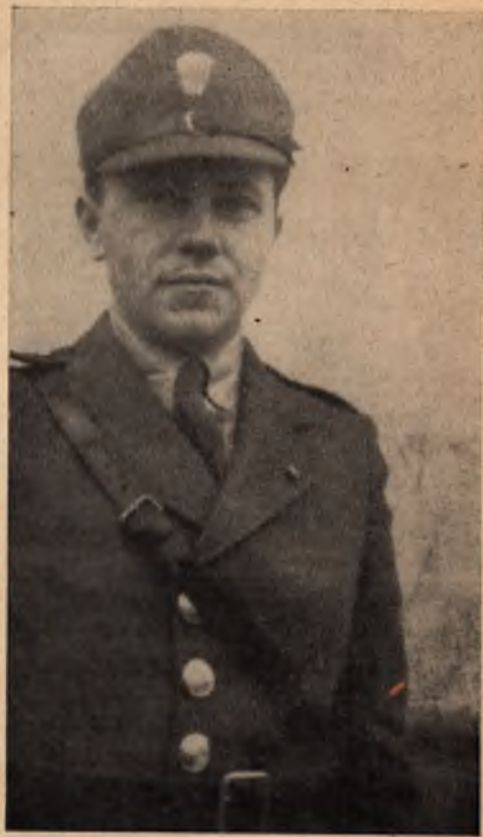
Іван Рогач, визначний член ОУН.