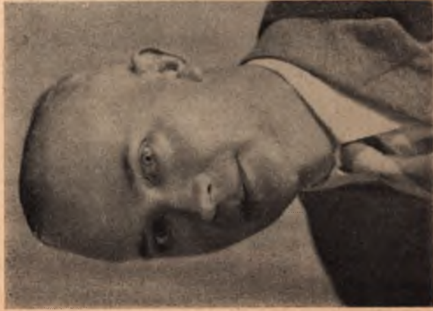
Сотник Омелян Сенник - Гривівський, члени Проводу Українських Націоналістів