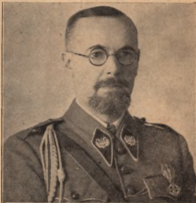
Ген. Микола Капустянський, член Проводу Українських Націоналістів