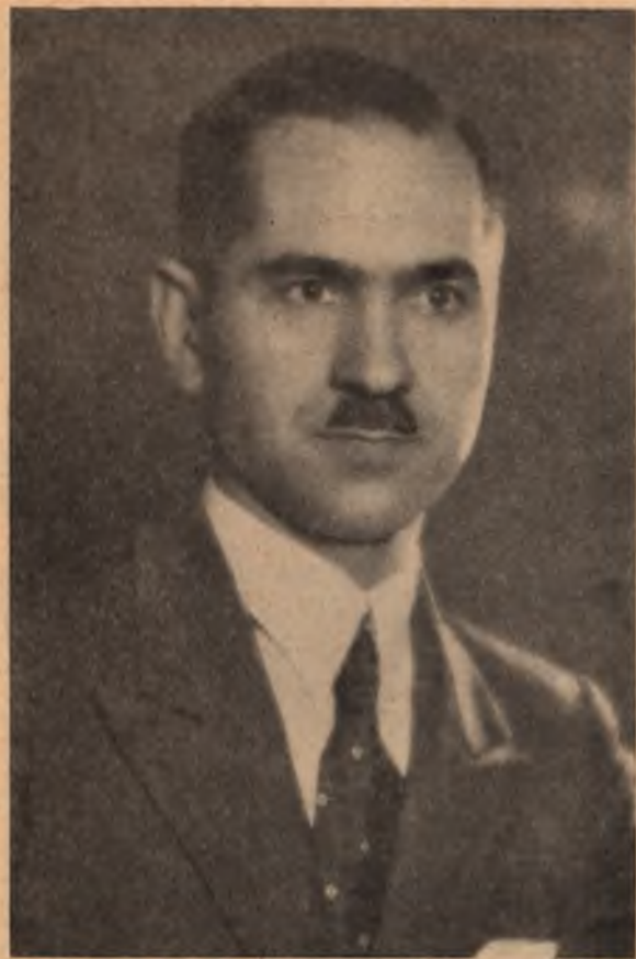
Полк. Роман Сушко, член Проводу Українських Націоналістів