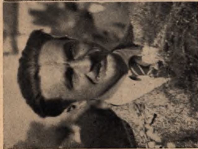
Д-р Ярослав Барановський, член Проводу Українських Націоналістів