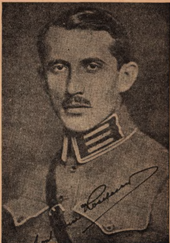
Полковник Євген Кошовий I-ий Голова Проводу Українських Націоналістів