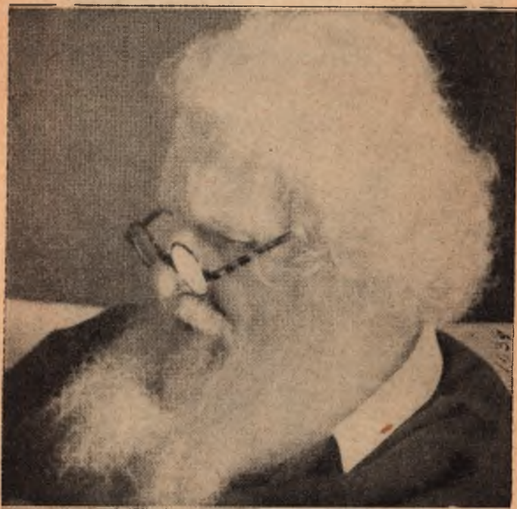
Митрополит Андрей граф Шептицький