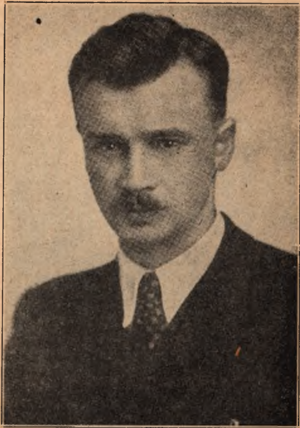
Д-р Олег Кандиба - Ольжич, член Проводу Українських Націоналістів