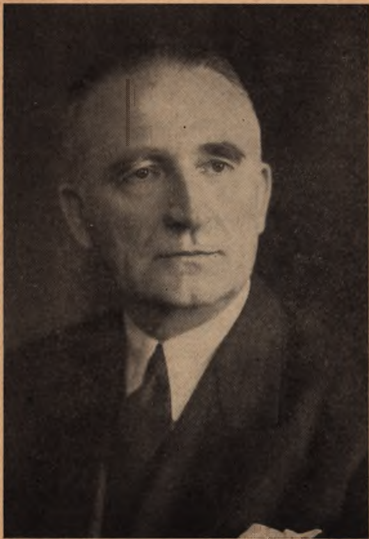
Полковник Андрій Мельник, Голова Проводу Українських Націоналістів