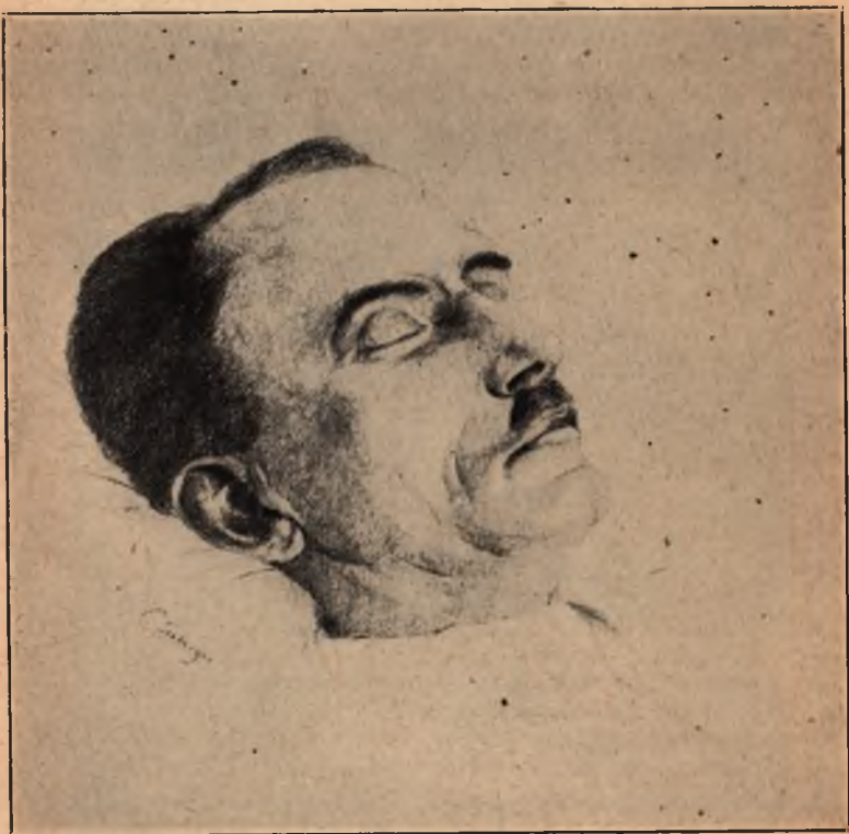
Посмертна маска полк. Є. Коновальця