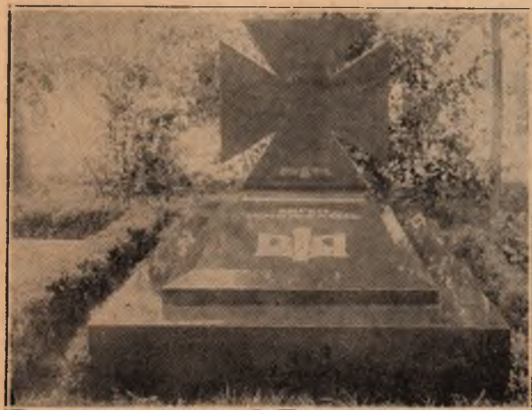
Могила полк. Є. Кошовий з пам'ятником в Роттердамі, в Голландії