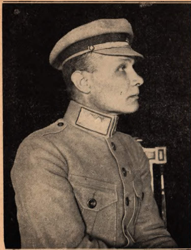
Ген. Віктор Курманович, член Проводу Українських Націоналістів