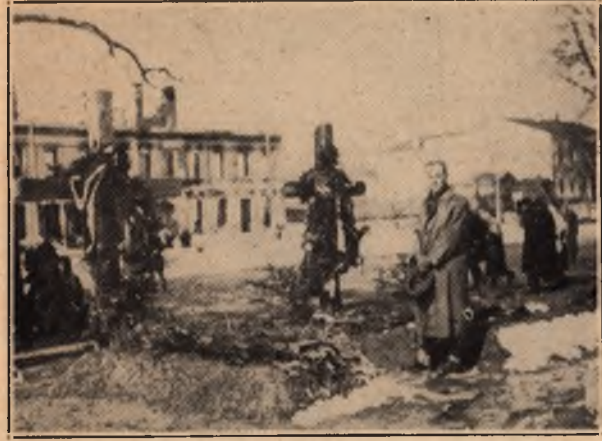
Могила Сенника - Гривівського і Сциборського коло Собору в Житомирі