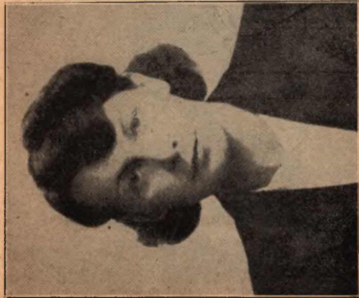
Олена Теліга поетеса українського націоналізму