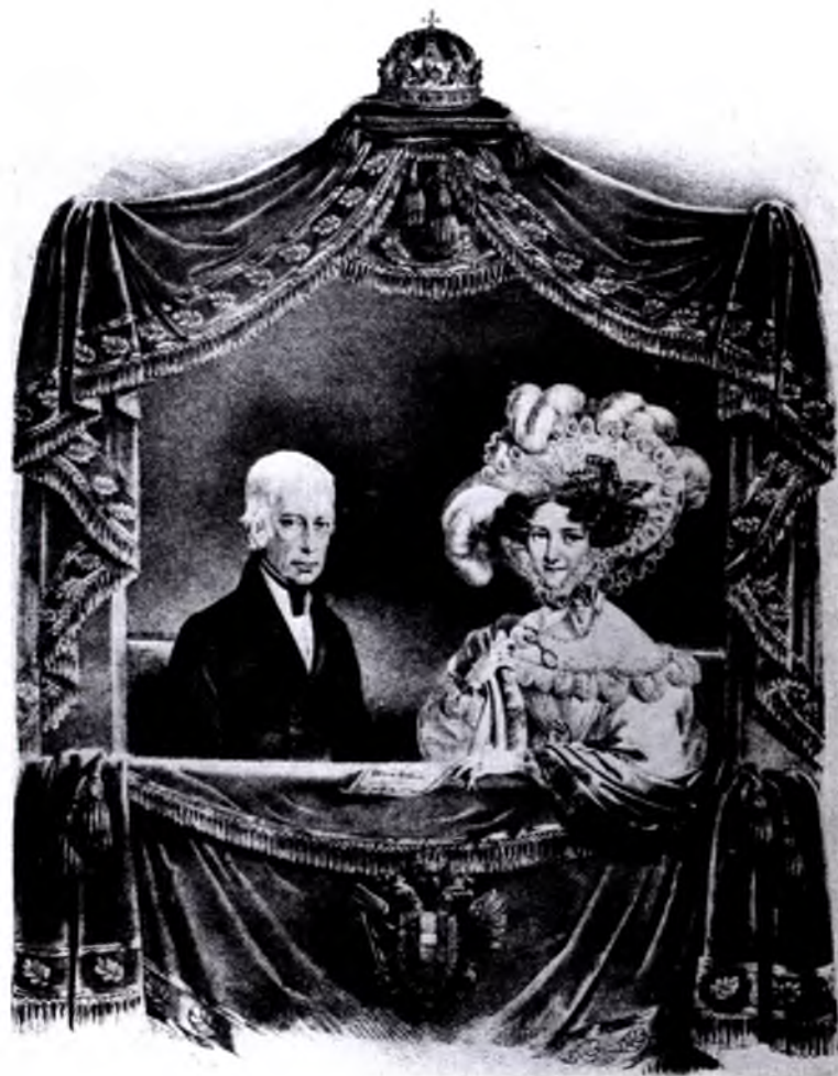
Імператор Франц та імператриця Кароліна Августа Літографія Йозефа Крігубера, за Йоганом Ендером

У 1861 р. сейми мали вплив лише як виборчі колегії до райхсрату. Вибори ж до самих сеймів були вельми складною справою. Депутатів обирали чотири окремі виборчі курії – великі землевласники, торговельні міські палати, міські виборчі округи й сільські виборці. Кожна курія голосувала окремо. Наприклад, із 54 богемських депутатів п'ятнадцятьох обрала курія великих землевласників, чотирьох – курія торговців, одного – празькі міщани, ще п'ятнадцятьох – міщани, поділені на 11 географічних груп і дев'ятнадцятьох – селяни, теж поділені на 11 географічних груп. Така система переслідувала подвійну мету: з одного боку, сейми заповнювали заможні люди, просто заради своєї власності, з другого – німці, заради «імперії сімдесяти мільйонів». У кожній із провінцій виборча система орієнтувалася на інтереси заможних верств і міщан, хоча консерватист Бісмарк уперше запровадив загальне виборче право в інтересах села. Це також був час «дивних пільг» в Англії, університетські виборчі округи були створені з надією посилення інтелектуальних