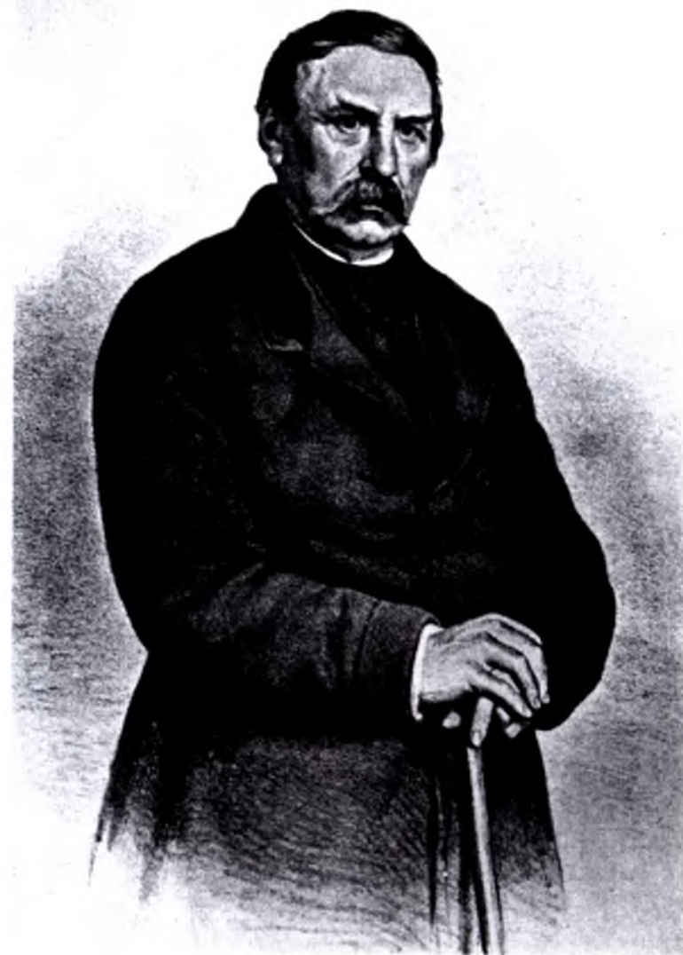
Франц Деак (1867) Літографія Йозефа Крігубера