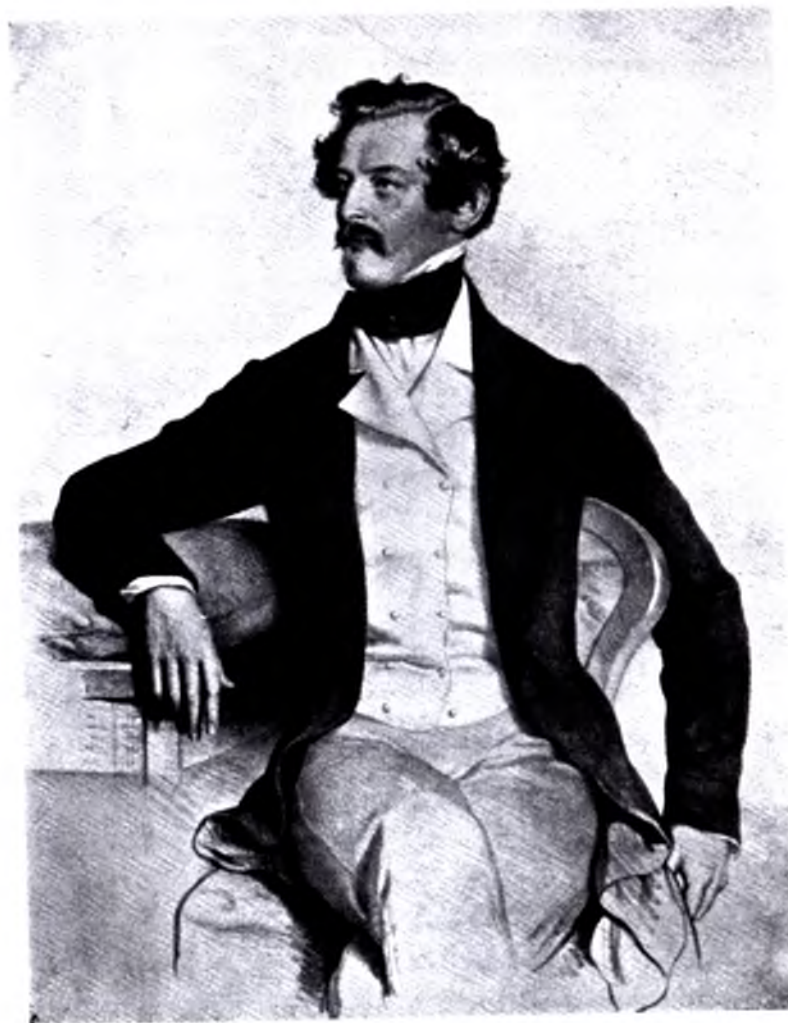
Олександр Бах (1840) Літографія Йозефа Крігубера