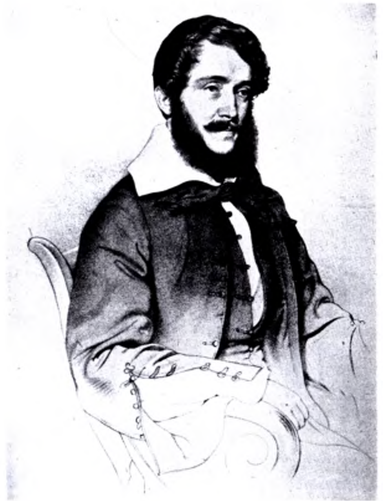
Кошут (1842) Літографія Йозефа Ейбля