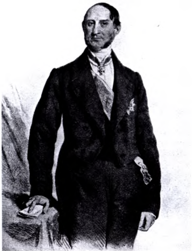
Антон Ріттер фон Шмерлінг Літографія Йозефа Крігубера