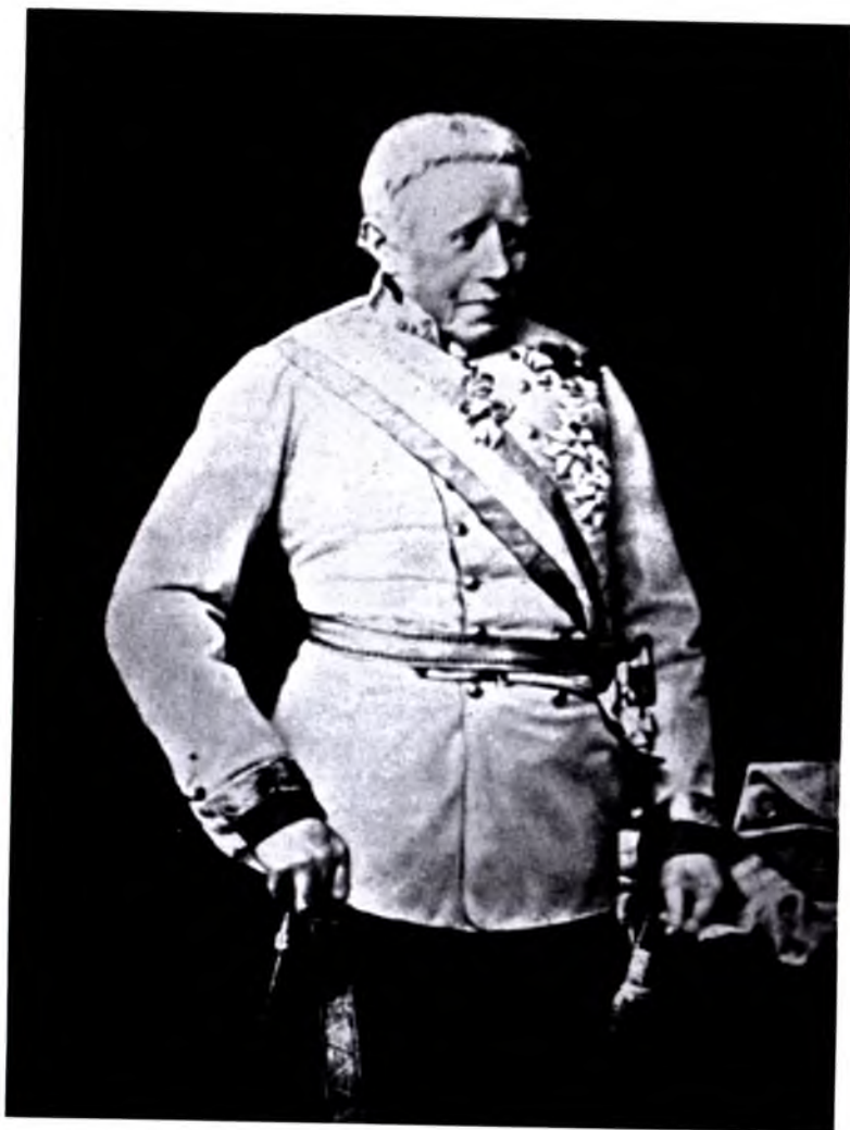
Фельдмаршал Радецький (1857)