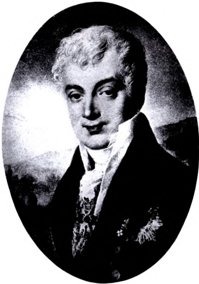
Меттерніх (1815) Мініатюра Яна Баттіста Ізабея