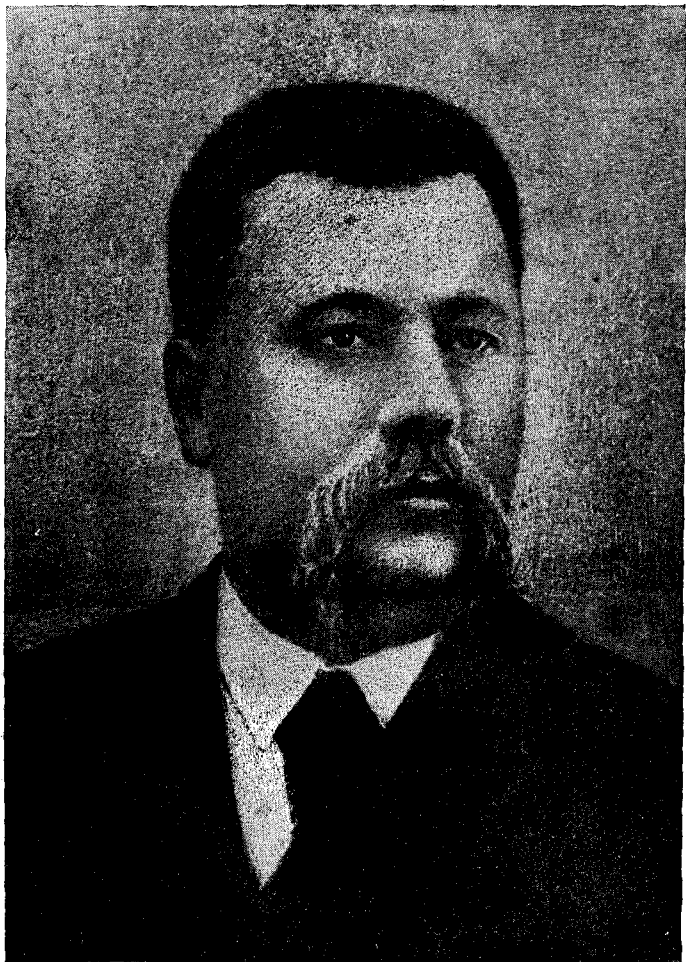
М. Л. Кропивницький