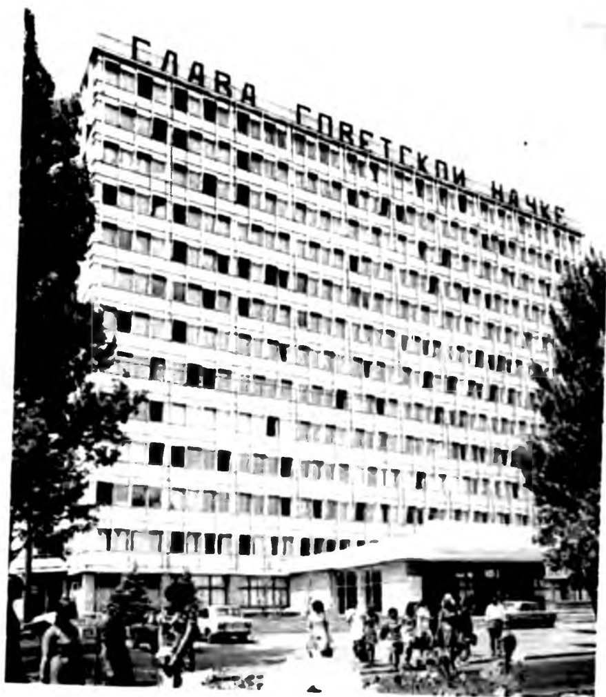
Приклад російщеневих заходів режиму: в українському місті Дніпропетровському (Січеславі) — гасло окупаційною російською мовою.