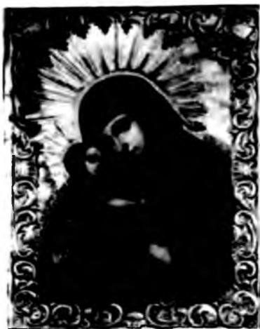
В.Боровиковський, Богородиця з Сином. Срібні шати

Великого українського мистця-маляра із Полтавщини Володимира Боровиковського (1757-1825) — автора ікони «Богородиця з Сином» та ін. полотен, у тому й чудотворної ікони на Алясці, совєтське мисецтвознавство (як і американське) називає «російським мистцем».