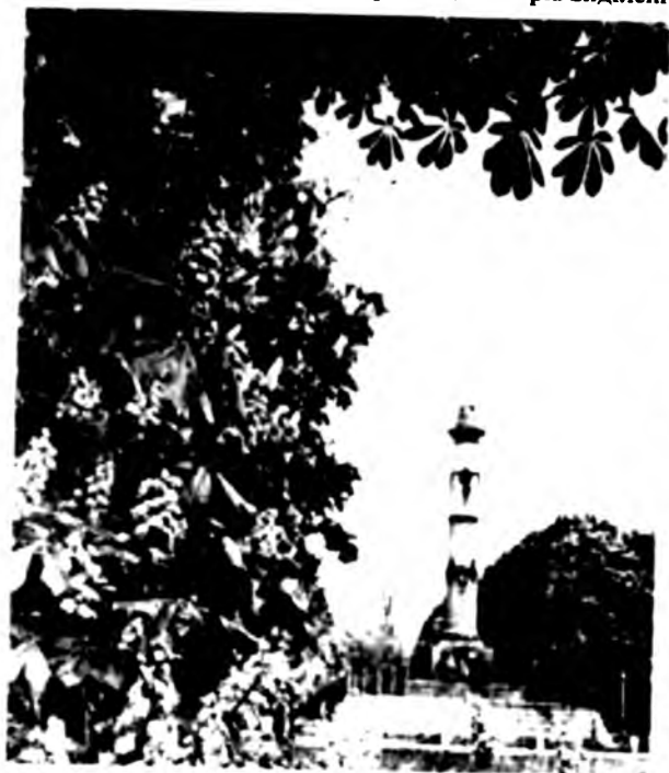
Колоніальна Україна у формі УССР: у м. Полтаві — пам'ятник перемогі царя Петра I, встановлений у 1807 році — «свято оберігається»...

* Джерела та імена й прізвища авторів виділені чорним шрифтом. — Ред.