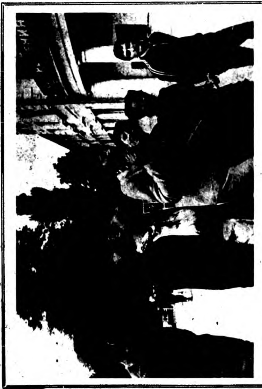
Студенти українського Педагогічного Інституту у м. Вінниці, а на будові — написи-гасла окупаційною мовою...