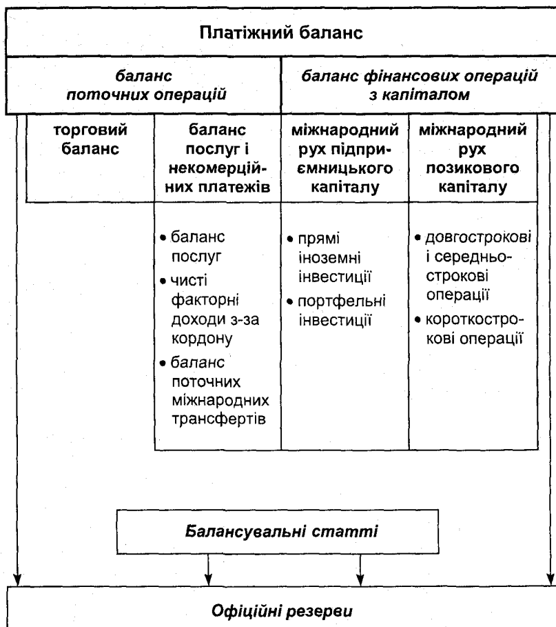
Схема 8.1. Структура платіжного балансу