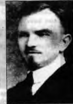
Левицький Михайло (1891, с. Явче Рогатинського р-ну – 1933, Сормово) – делегат II Конгресу Комінтерну, де зустрічався з В. Леніним, репресований.