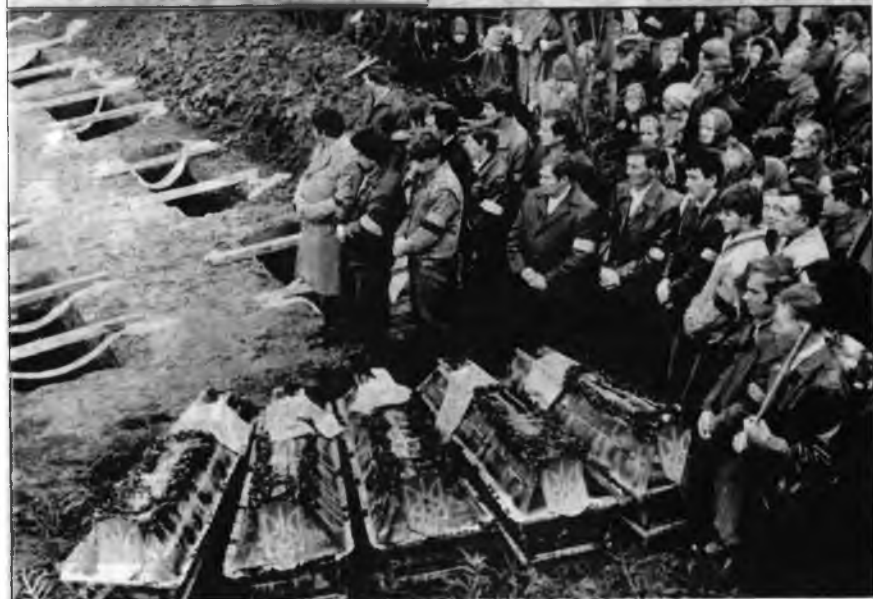
ПЕРЕЗАХОРОНЕННЯ ЖЕРТВ СТАЛІНСЬКИХ РЕПРЕСІЙ НА ГАЛИЧ-ГОРИ. 1990 РІК.

21. Розв'язання імперіалістичних воєн у країнах Європи, Азії, Африки, в результаті яких за-