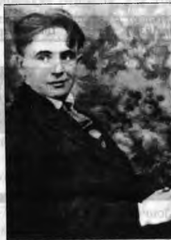
Курбас Лесь (1887-1938) – славетний актор і режисер.