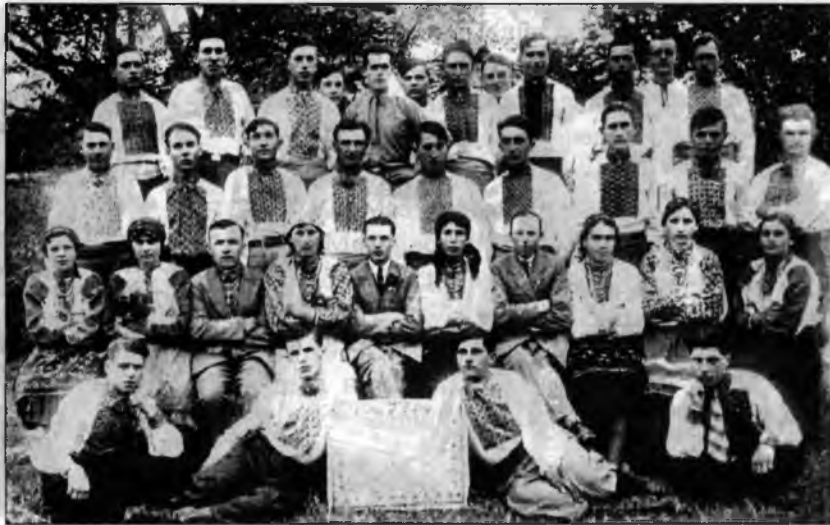
Аматорський гурток товариства „Просвіта“ зі Старих Кутів, більшість членів якого були заарештовані в 1940 р.