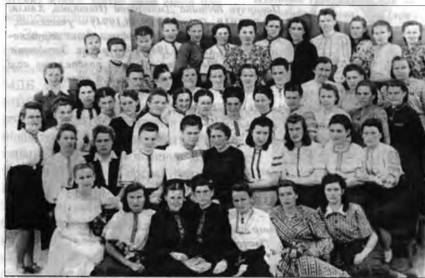
Галичанки — в'язні сталінських таборів. Тайшет, Воркута-Сейда, 1954 р.

ЖІНКИ! ДОСИТЬ ОКУПАНТСЬКИХ ЗНУЩАНЬ В УКРАЇНІ. ДОСИТЬ НАМ ДИВИТИСЯ НА ЛОВЛЮ НАШИХ ДІТЕЙ, НА ІХНЮ СМЕРТЬ НА ТОРТУРАХ. ГЕТЬ СТАЛІНСЬКІ ВАР- ВАРСЬКІ ОБЛАВИ! СМЕРТЬ ЕНКАВЕДІВ- СЬКИМ ЛЮДОЛОВАМ! У ЛАВАХ ОУН, УПА НАШІ ДІТИ ВИБОРЮЮТЬ СОБІ І СВОЇМ НАЩАДКАМ СПОКІЙНЕ ЗАВТРА ХАЙ ЖИВЕ УКРАЇНСЬКА САМОС- ТІЙНА СОБОРНА ДЕРЖАВА!!!