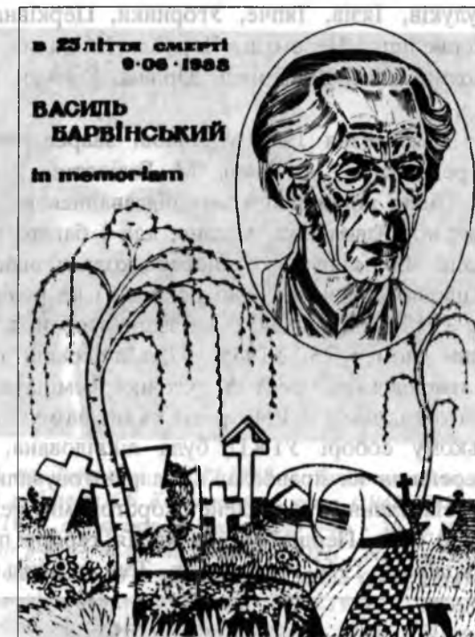
Барвінський Василь (1888, Тернопіль – 1963, Львів) – композитор, піаніст і музикознавець. 1948 р. засуджений більшовиками на 10 років ув'язнення.

Гаврилівка, Галич, Глибівка, Глибока, Глушків, Голинь, Городенка, Грабівці, Делятин, Деліїв, Дем'янів, Драгомирчани, Єзупіль, Жаб'є, Жидачів, Желибори, Журів, Заболотів, Загір'я, Заріччя, Іванівці, Іллінці, Ісаків, Калуш, Карлів, Княж, Князівське, Коломия, Камінна, Колоколин, Коростовичі, Коршів, Клубівці, Красноставці, Кути, Лисець, Ліска, Лоева, Львів, Любківці, Майдан, Мартинів, Марківці, Микулинці, Милування, Микуличин, Мишин, Надвірна, Надіїв, Негівці, Нижнів, Олешів, Перегінськ, Підвербівці, Пороги, Псари, Пукасівці, Різдяни, Рівня, Рогатин, Рожнятів, Рожнів, Рудники, Русів, Саджава, Семаківці, Снятин, Старий Самбір, Серафінці, Сваричів, Спас, Станіслав, Стратин, Стецева, Стецівка, Татарів, Темирівці, Тисмениця, Товмач, Товмачик, Тростянець,