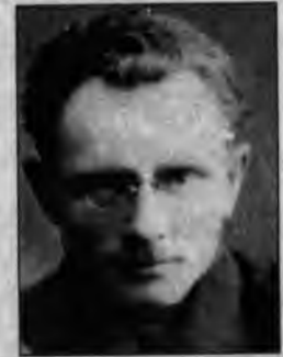
Заячківський Мирон (1897, Коломия – 1937), лікар в УГА – ЧУГА. Згодом перший секретар ЦК КПЗУ. Автор ряду теоретичних праць. В 1933 відкликаний з підпільної роботи у Харків і незаконно засуджений на 10 років ув'язнення, яке відбував в Архангельській області.

Після цього західноукраїнських комуністів безпідставно оголосили розкольниками, агентами польського фашизму, тому серед багатьох галичан, які працювали на Радянській Україні, в першу чергу жертвами сталінських репресій стали засновники КПЗУ Карло Саврич і Василь Сірко, члени ЦК КПЗУ В. Корбутяк, М. Заячківський, перший секретар ЦК КПЗУ з 1928 р., колишній член ОК КПЗУ Д. Лазорко з Городенки, члени ЦК Сельробу К. Вальницький і Й. Букшований, партійні і державні діячі М. Левицький, В. Порайко зі с. Устя, делегат II з'їзду КПЗУ Б. Еленяк із Тростянця, члени КПЗУ В. Гоцанюк із с. Маняви, С. Томенко з Дебеславців, учасники Заболотівської першотравневої демонстрації у 1924 р. Т. Іванчук з Ілинців, Д. Павлюк