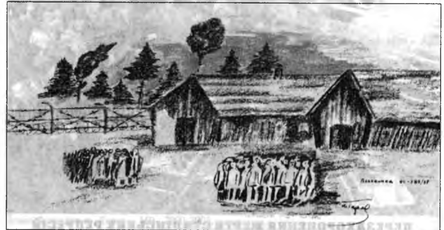
Концтабір Половинка, Урал.