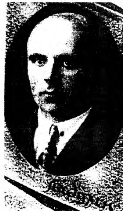
/1931 рік/.