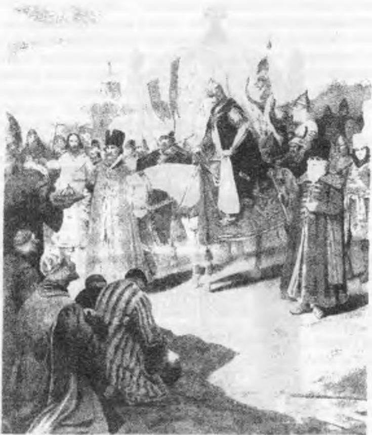
Взяття Казані Іваном Грозним. 1552 рік