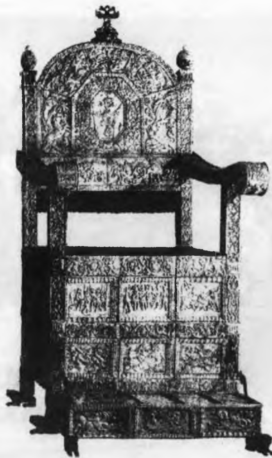
Трон Івана Грозного

Проте, слід зауважити, що в сучасній російській історіографії прослідковуються спроби виправдати державницьку діяльність Івана IV. На думку, вже вище згадуваних В.Н.Кожемякіна та А.І.Подберезкіна, ідеї “боговибраності” російського царя та російської державності відіграли позитивну роль в історії Росії. Вони стимулювали в політичному аспекті “більш інтенсивне розгортання процесів національної консолідації” 17 .