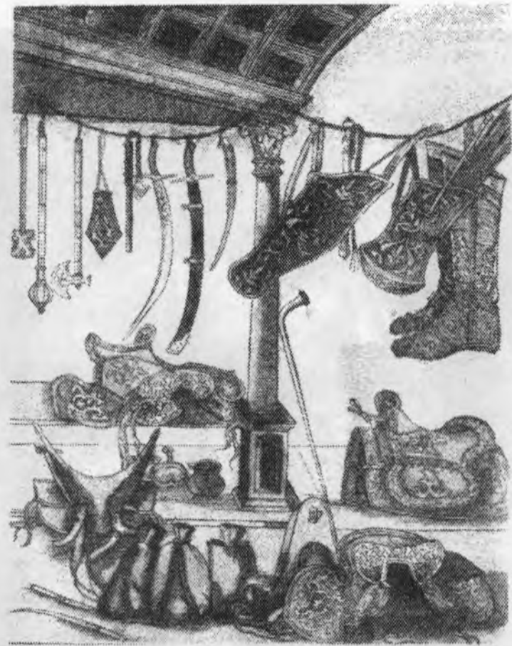
Озброєння вершника. XVI ст.