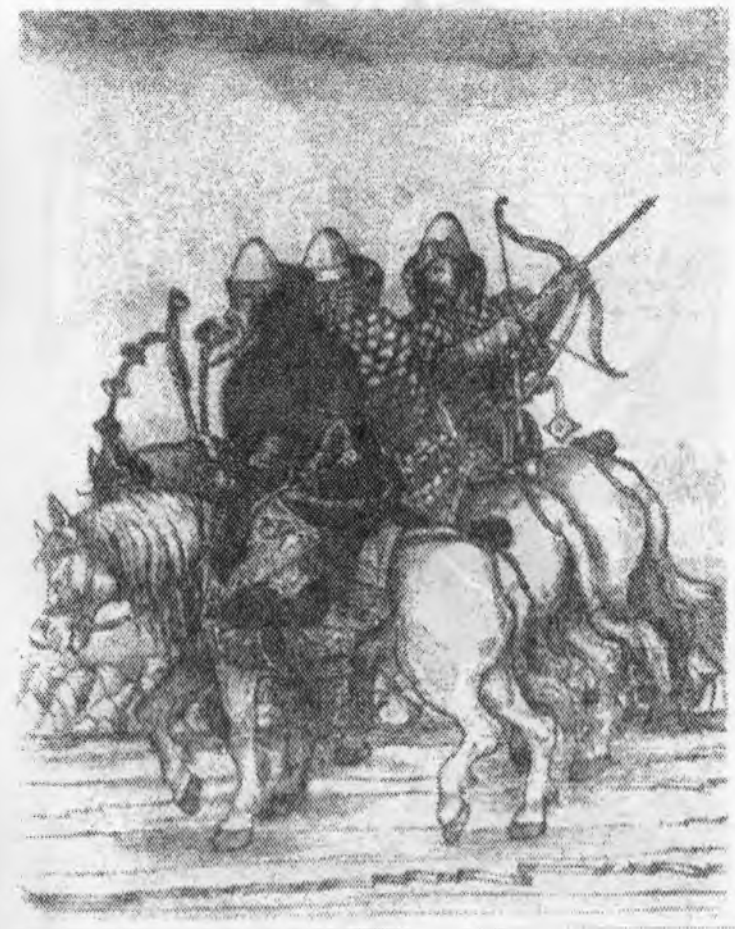
Дворянська кіннота. XVI ст.