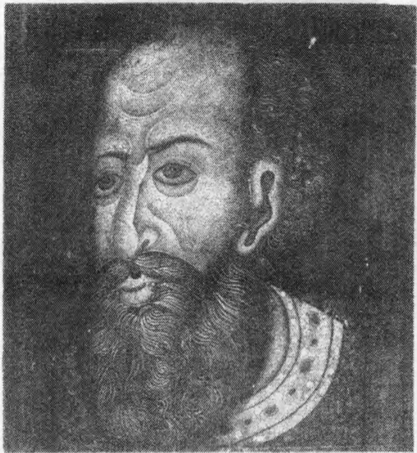
Іван IV. Портрет XVI ст.