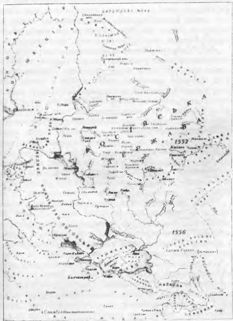
Російська держава в середині XVI ст.

1552 р - роки приєднання тагарських ханств до Росії ..... - кордони Російської держави