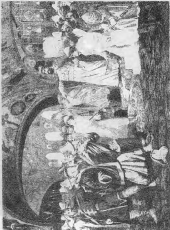
Іван III розриває ханську грамоту і басму перед татарськими послами. 1478 рік