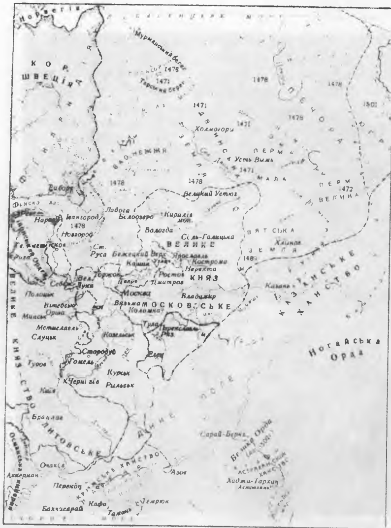
Утворення Російської централізованої держави (друга половина XV перша третина XVI ст.)

1471 р. роки приєднання руських земель та князівств до Москви ..... - кордони Російської держави на 1533 р