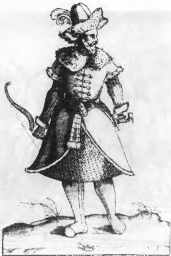
Московит у військовогому однострої. XVI ст.