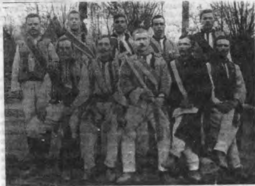
Старшина "Січі" в Городниці, пов. Городенка.

Праця в товаристві молоді ішла згідно з вказівками, які прислав д-р Трильовський. Сіховики вчилися вільноручних вправ, що їх укладав сам Трильовський, а також робили гімнастичні вправи, а при тому вивчали впоряд та робили походи, дуже часто Сіховики з одного села відвідували похідними колонами Сіховиків у сусідніх селах, а при тому, йдучи дорогою, співали пісень, які широко лунали по селах. Весняною та літньою порою влаштовували Сіхові свята, на які сходилися тисячі людей. Варто було бачити, як виглядав похід "Січі". Напереді йшов, а часто їхав на коні, кошовий, перев'язаний через плечі відзнакою кошового; синьо-жовтою широкою тканиною з вовни, лентою. За ним йшов хорунжий і ніс сіховий прапр. Відзнакою хорунжого була широка лента з порядком кольорів — синій-жовтий-синій. По обох боках хорунжого