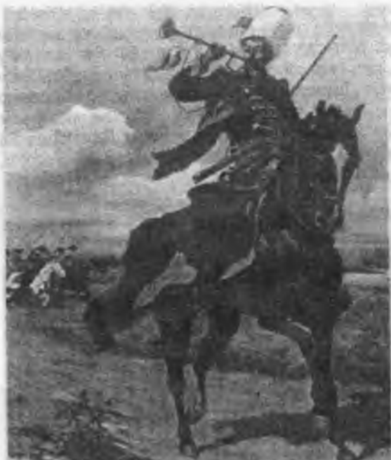
Шевченковий ювілейний знім "Сокла Батька", "Укр. Січового Союзу" і "Спортивного Товариства Україна". Львів 28. і 29.06.1914.