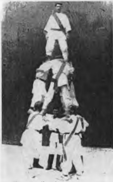
Січовики з Печенжини при вправах.