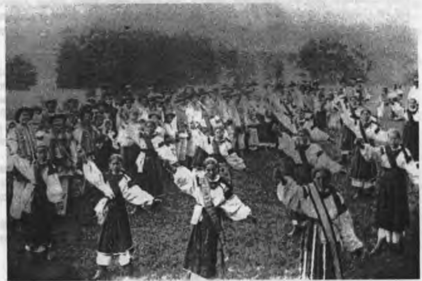
Січовички з Микитинець Косівського повіту при вправах, поч. 20 ст.

"Ой, Трилю, Трилю, тримайся здалека! Чекає на тебе у Жабю смерека!.."