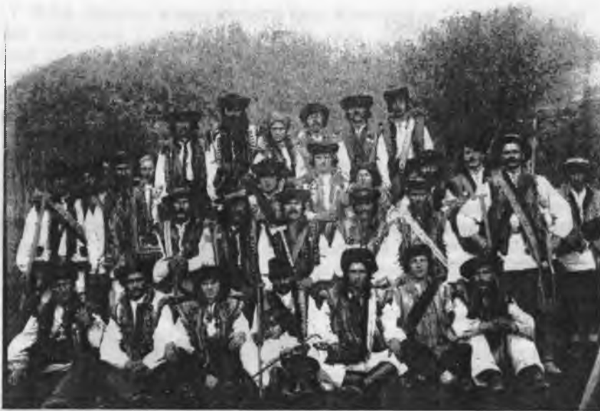
"Січ" — Яворів, пов. Косів.

Щоб рятувати селян від поширеної між ними язви — пиянства, закладаються по селах Покуття, Поділля і в інших сторонах Галичини "Братства тверезости", читальні і "Січі", що їх основував Д-р Кирило Трильовський. На долах Покуття грімко лунала січова пісня, в якій приходили, між іншим, слова: "В кождім селі на Підгірю, гей, наша слава ходить в пірю! Кождий хлопець, як та перла, гей, та співає "Ще не вмерла!..".