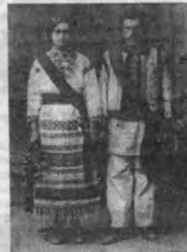
Січовичка та четар "Січі", с. Ілїнци, 1914 р.

Саме при кінці здвигу намісник одержав вістку, що того дня вбито в Сараєві австрійського престолонаслідника Франца-Фердинанда і його жінку. Внаслідок того