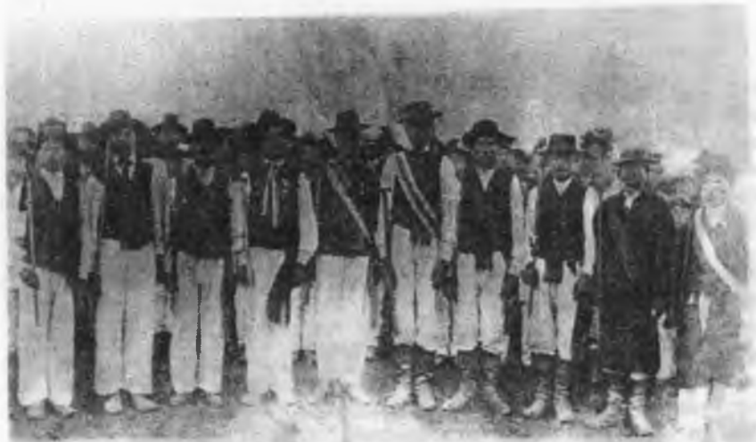
Січовики — Серафінці, пов. Городенка.

Так було і з радикальним рухом у Галичині. Це був у своїх початках рух молоді, незважаючи на те, що батьком цього руху був М.Драгоманів, маючи вже понад 35 років. Іван Франко, Михайло Павлик та інші їх приятелі, що починали цей рух, були тоді двадцятилітніми студентами. З того факту був такий наслідок, що тоді меншу увагу звертали на практичну суспільно-політичну програму, а більше на ідеологію. Окрім цього, молодь любила свої форми руху — певну таємничість, яка не конче була потрібна в конституційних умовах. Це видно найліпше на характері молодечих "Драгоманівських Громад".