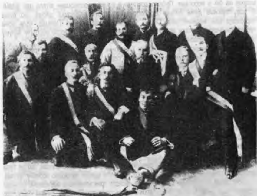
З'їзд делегатів "Січей" Городенківського повіту, 1912 р.

Окружні Свята відбувалися в Станиславові, Городенці, а також у Коломиї. На ці свята прибували сотні січових товариств похідними колонами з прапорами, оркестрами та музиками. Разом із ними приїздили возами тисячі людей, яких число доходило до 10.000 осіб. (Кожна "Січ" мала свою народну ношу. Вбиралися, звичайно, так, що певні частини ноші, як капелюхи, штани у хлопців — хустки та спідниці у дівчат, були в давній "Січі" всі однакові. Це справляло дуже гарне враження. Також дуже гарне враження справляли малинові прапори, на яких були портрети українських історичних осіб: Хмельницького Дорошенка, Мазепи, Шевченка, Драгоманова та інших. На другій стороні прапора був намальований або галицький лев, або січова восьмикутна зірка з двома руками, що держали серп посередині. Від 1919 року в "Січах" заведено