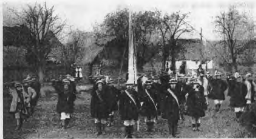
Січ на вправах в Джурові, пов. Снятин.