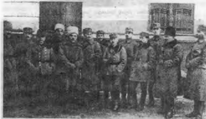
Полк. Дмитро Вітовський з референтами Військового Секретаріату, зимою 1918 р.

УСС під керівництвом сотника Д.Вітовського повалили у Львові 1.11.1918 р. австрійську владу і проголосили створення Західно-Української Народної Республіки. Трильовський входив до складу Національної Ради ЗУНР.