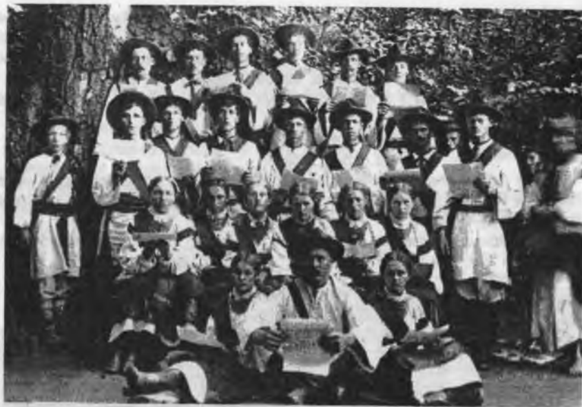
Хор "Січі" в Печенжині.

У "Січах" панував демократичний дух: кожного члена старшини не тільки формально обирали, але і перевіряли, чи він годиться до виконання своїх обов'язків. Отже, "Січ" продовжувала демократичні традиції славної Запорізької Січі і козаччини. Звертання до