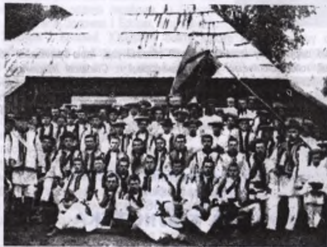
Перша "Січ" — Завалле, пов. Снятин.

(до 100-річчя створення спортивно-пожежного товариства "Січ" у с. Заваллі)