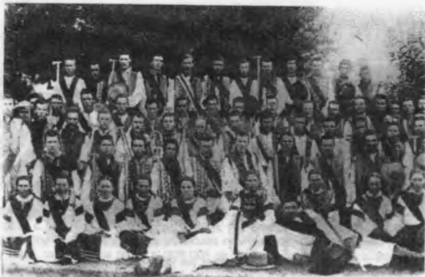
Січ в Корничі, пов. Коломия.

рух "Сіхових Стрільців", який оформився опісля в організацію "Українських Сіхових Стрільців" або, як їх у скороченні називали, "УСС-ів".