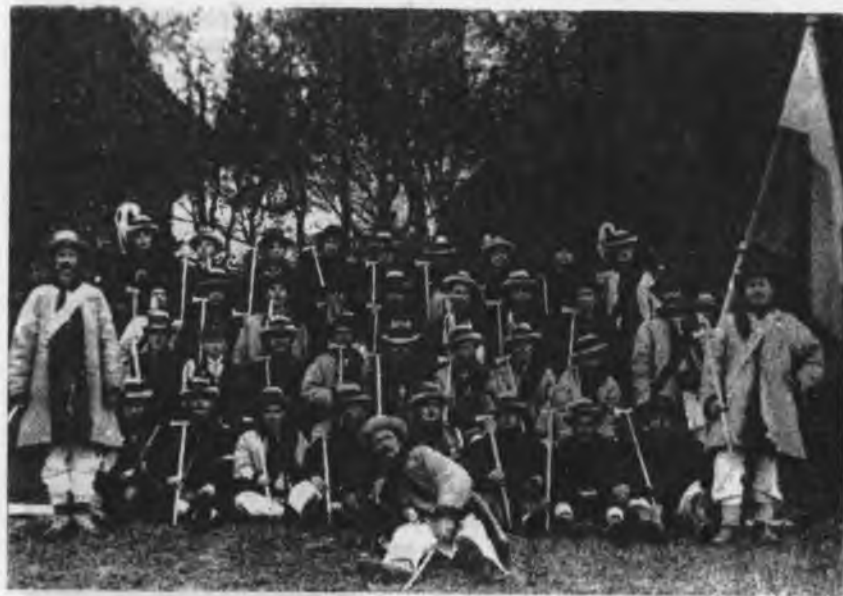
Січовики в Ілінцях, пов. Снятин.