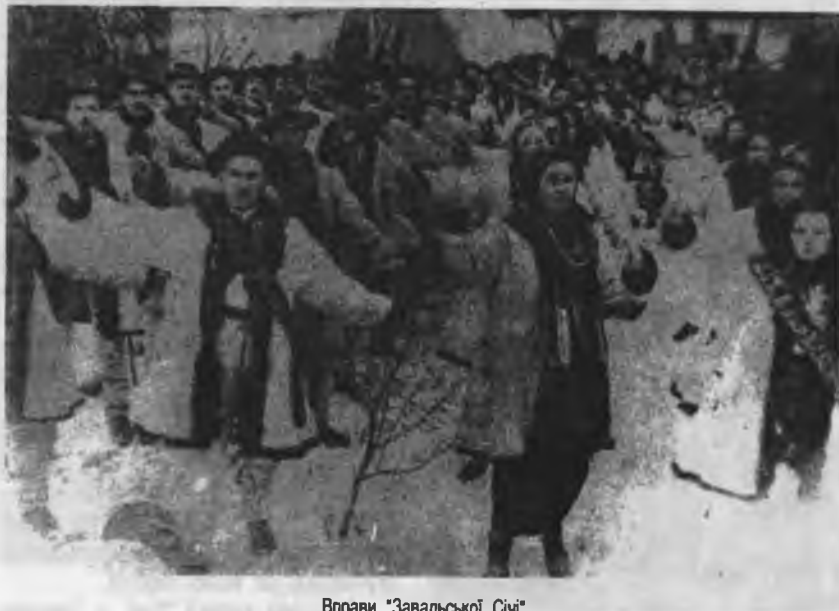
Вправи "Завальської Січі".