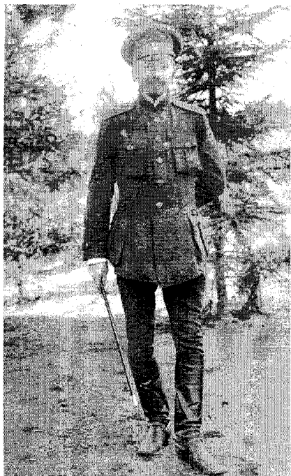
На фронті Першої світової війни

зараховано також Слобідський Гайдамацький кіш, отаманом якого був Симон Петлюра.