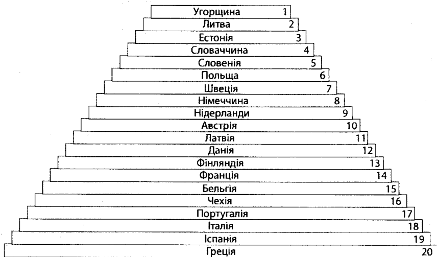
Рис. 1. Шенгенські консульства в оцінках і рейтингах

Місцевий прикордонний рух: форми та умови. За результатами Всеукраїнського моніторингу видачі віз громадянам України консульськими установами країн ЄС на території України, який уже сьомий рік поспіль проводиться Міжнародним консорціумом «Європа без бар'єрів», візова політика країн Вишеградської групи щодо українців визначена як «дружня» порівняно з іншими країнами Шенгенської зони (рис. 1) 52 .