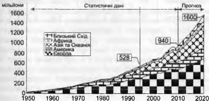
Рис. 2. Динаміка розвитку туризму у 1950–2020 рр.

Світовий досвід показує, що впродовж останніх 25 років спостерігалися окремі фази підйому та падіння туристичних показників. Періоди швидкого росту спостерігалися у 1995, 1996, 2000, 2004, 2007 рр., а періоди повільного росту – 2001, 2003, 2008, 2009 рр. Нижче на рис. 2 показано перспективну динаміку розвитку туризму у 1950–2020 рр.