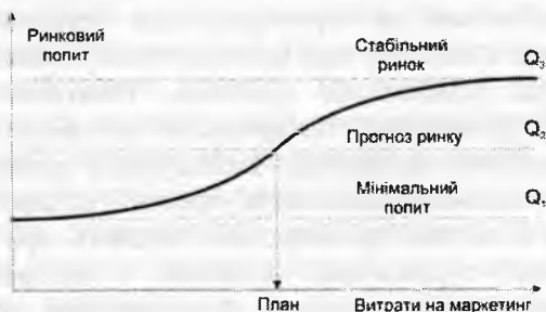
Рис. 3. Графік залежності попиту від витрат на маркетинг

Кожний виробник товару може оцінити ринковий попит на свою продукцію в кожній галузі. Можна визначити також попит за певний період або прогноз його на перспективу. На ринковий попит впливають різні маркетингові плани. Попит завжди характеризується еластичністю, пов'язаною з ціною, сервісним обслуговуванням, якістю. Отже, сукупні затрати підприємства на маркетинг повинні впливати на ринковий попит (рис. 3).