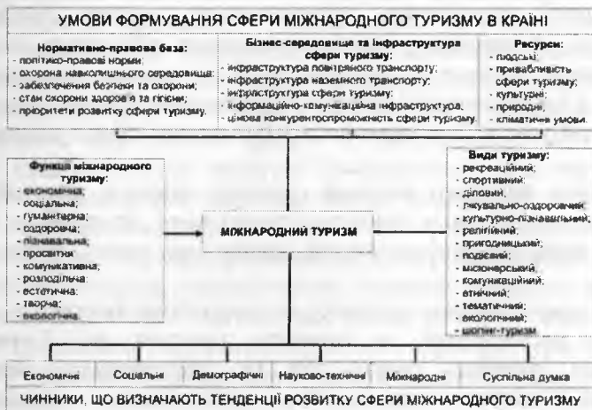
Рис. 1. Організаційний механізм функціонування міжнародного туризму.

Важливою умовою розвитку індустрії міжнародного туризму є політико-правове середовище, що передбачає наявність певної правової основи, гарантування екологічної стійкості та охорони навколишнього середовища, забезпечення належного рівня безпеки та охорони, розвиток системи охорони здоров'я та гігієни, визнані на державному рівні пріоритети розвитку сфери туризму. З точки зору