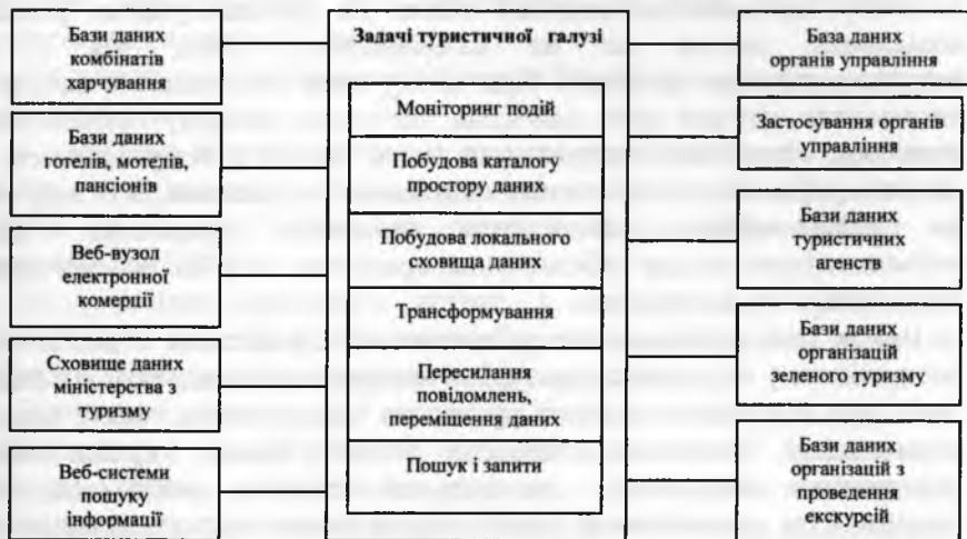
Рис. 7. Об'єкти туристичної сфери та задачі, що перед ними ставляться.

Організатори туризму користуються великим спектром інформаційних послуг. Формуючи туристичний продукт, вони вивчають спеціальні професійні путівники. Всесвітній туристичний путівник «WorldTravelGuide», який щороку перевидає видавництво «ColumbusPress», містить детальні описи за однаковими схемами 200 країн, туристичних центрів і територій. Видаються також різноманітні каталоги туристичних агентств і туристичних операторів, розклади руху транспорту різних країн і навіть всього світу. Такі розклади є в електронному вигляді на CD-дисках, а також у глобальних світових інформаційних системах, системах автоматизованого бронювання туристичних послуг (Amadeus, Sabreta ін.).