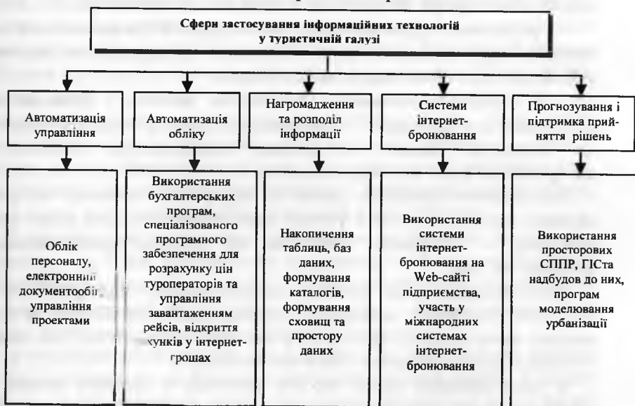
Рис. 6. Сфери застосування інформаційних технологій у туристичній галузі

Інформаційні технології, що використовуються в туристичній галузі, можна поділити на класи, зображені на рис. 6.