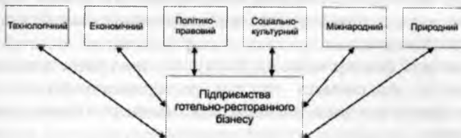
Рис. 4. Фактори непрямого впливу на сферу готельно-ресторанного бізнесу

Для організацій, що відносяться до сфери готельно-ресторанного бізнесу і діють в межах внутрішнього ринку, група факторів непрямої дії включає: технологічний, економічний, політико-правовий, соціально-культурний, міжнародний і природний (рис. 4).