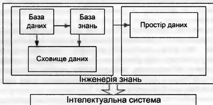
Рис. 5. Елементи інженерії знань

У основі будь-якої аналітичної системи лежить база даних. Інтелектуальна система (ІС) – система, що базується на знаннях і використовується для підтримки прийняття рішень та отримання нових знань на базі методів інженерії знань. Термін «інтелектуальна система» проілюстрований на рис. 5.