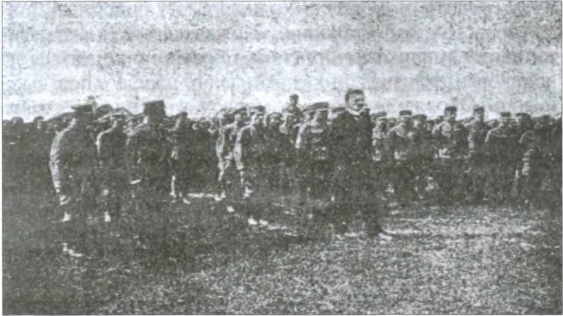
Перегляд військ У. Г. А. Президентом З. У. Н. Р. в Кам'янці Подільським 1919 р.

своє власне життя! Не смієш тоді чекати справедливості від когонебудь, бо тоді з тебе мізерний невільник і раб! Тоді ти заслугуєш на те, щоб тебе лютий кат бив, з тебе кепкував і тебе мордував, бо у твоїх жилах не пливе жива, гаряча кров людини, тільки гнила, вонюча вода трупа! За сміх і глум над тобою, за знущання над твоїм народом відповідай безстыдному чужому зайді й розбійникові сейчас на місці страшною помстою і смертю!”