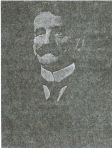
DR. EUGENE PETRUSHEVICH President of Galicia (West Ukrainian Republic) EAST GALICIA THE KEY TO PERMANENT PEACE IN EASTERN EUROPE

Moral Support to An Oppressed and Liberty-Loving People, Seeking Self Determination.