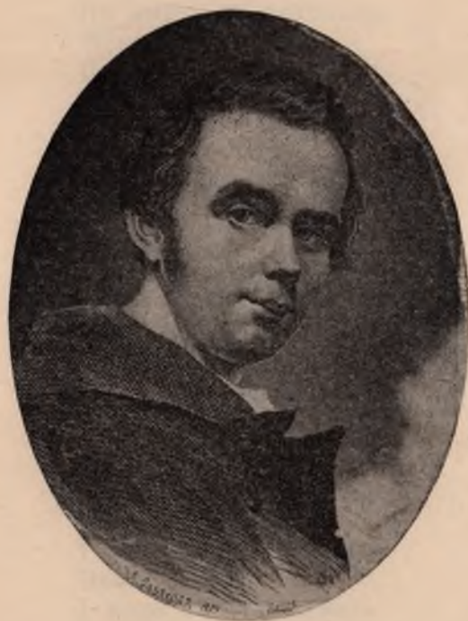
Т. Шевченко в молодім віці.