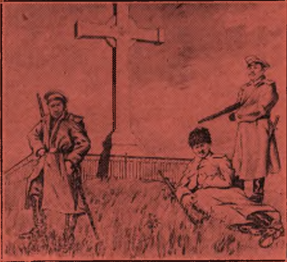
На могилі Т. Шевченка в 1914 р.