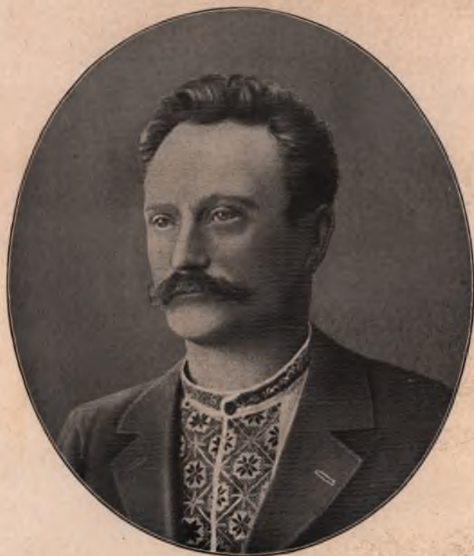
Др Іван Франко.