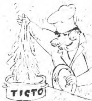
Мал. К. МАЛЬЦЕВА.