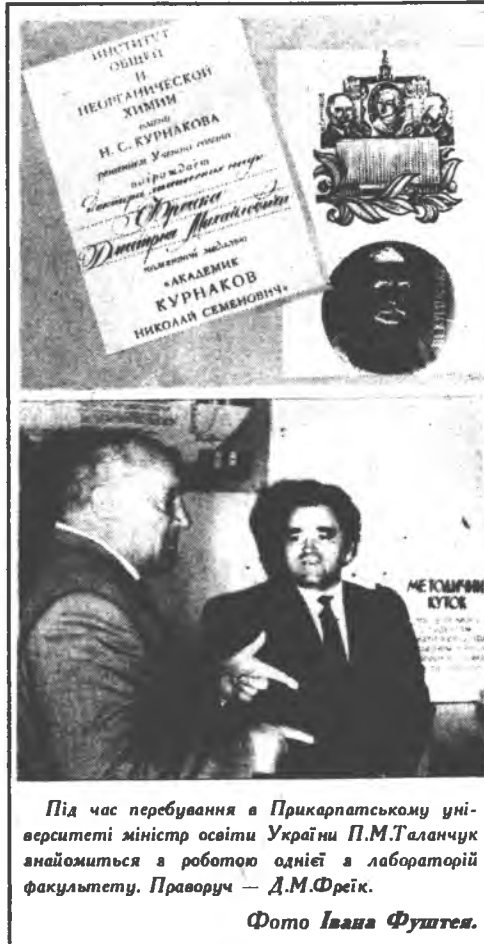
Під час перебування в Прикарпатському університеті міністр освіти України П.М.Таланчук анайомиться з роботою однієї з лабораторій факультету. Праворуч — Д.М.Фрейк.

випарника, підкладок, стінок камери, а також парціального тиску халькогена у методі гарячої стінки. Доказана можливість термодинамічного підходу у поясненні технологічних діаграм. На основі квазіхімічних реакцій опису процесів випаровування і конденсації пари одержані узагальнені рівняння