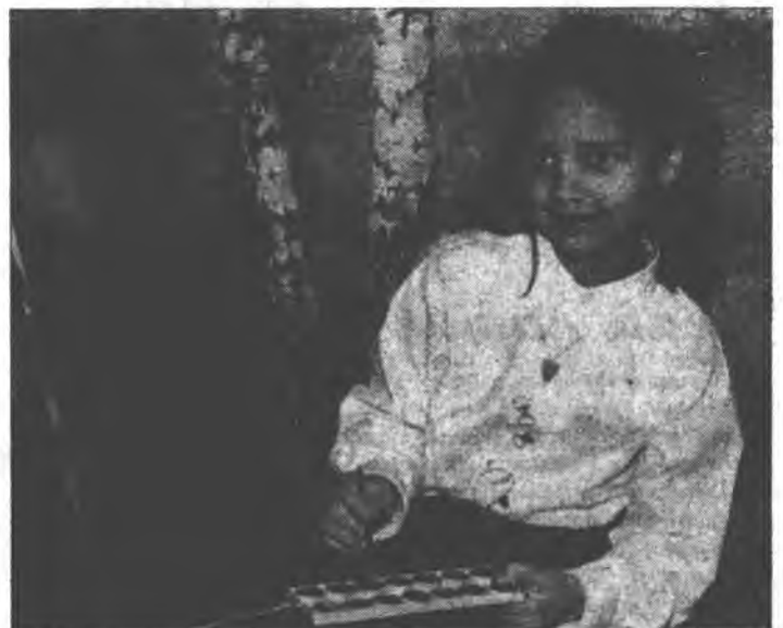
Юна художниця. Фото Оксани Фуштей (6 кл.), фотостудія «Світлінка».

м. Івано-Франківськ, вул. Шевченка, 57, 2-й поверх, каб. 209, «Alma Mater», тел.: 96-413, 96-441. Відповідальна за випуск МАРІЯ КРІЛЬ. Художнє оформлення Тетяни Михайлівської, фотографії Івана Фуштей та учня 7-го класу СШ № 21, члена фотостудії «Світлинки» Павліка Валька.