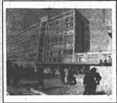
Газета Прикарпатського університету «Педагог Прикарпаття»

Головний редактор Євген Гордица 4-5 (131-132) березень 1993 року