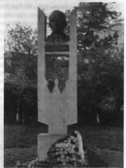
Пам'ятник С.Бандері в Коломиї

демократичних сил м. Коломиї було прийнято ухвалу присвоїти одній з