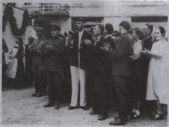
Мітинг у Станіславі на честь визволення міста. В центрі М.Король (1944 р.)

Червоноградську технічну середню школу. З 1924 по 1926 рр. працював столяром, потім техніком на Карлівському цукрозаводі. У 1926-1927-учитель в Олешівській школі Кадіївського району Донецької області. Пізніше