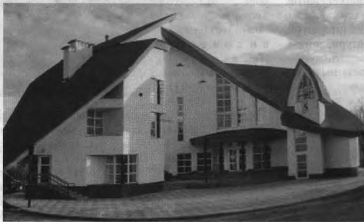
Історико-меморіальний музей Степана Бандери в с.Старий Угринів Калуського району Івано-Франківської області

у маскувальних халатах. Мабуть, така ж доля чекала й на третій пам'ятник