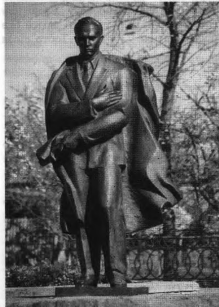
Пам'ятник провідникові ОУН С.Бандері в його рідному селі Старий Угринів

Восени 2007 року неподалік Івано-Франківська в с.Узині Тисменицького району з нагоди