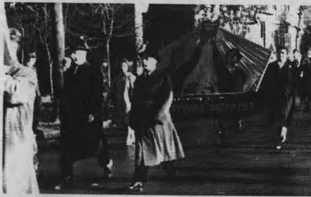
Колона педінституту на жовтневій демонстрації. 1963 р.