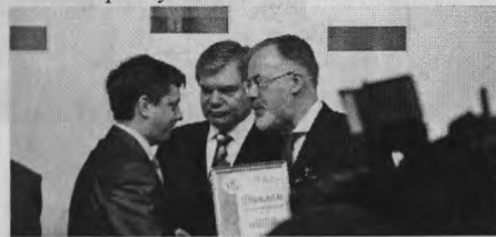
Вручення диплома «Лідер наукової діяльності»