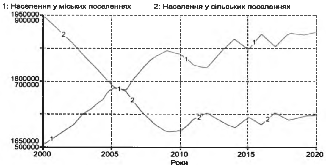
Рис. 2. Населення у МП та СП без врахування екології та зовнішньої міграції (осіб)

Згідно отриманих прогнозних даних на довгострокову перспективу демографічна ситуація в області характеризується тенденцією до скорочення загальної чисельності населення, що обумовлено зменшенням рівня народжуваності, від’ємним або незначним додатним природним приростом та значним міграційним відтоком за межі області. Показники природного руху населення відрізняються у сільській та міській місцевостях. Народжуваність у міських поселеннях вища, але і більш високий рівень смертності порівняно із сільською місцевістю.