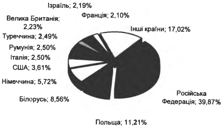
Рис. 2. Частка іноземних туристів, які відвідали Україну у 2011 році

У 2011 році Україну відвідали близько 21.415.296 іноземних громадян (включно з одинокими відвідувачами), серед них з метою туризму – 1.225.954 особи [1]. Це на 1% більше, порівняно з даними 2010 року. Приблизно 40% туристів приїжджали торік із Російської Федерації, 11% – з Польщі, 9% – з Білорусі. Серед туристів, що демонструють інтерес до України як до популярного туристичного напрямку варто виділити: Німеччину, США, Італію, Румунію, Туреччину, Велику Британію, Ізраїль та Францію.