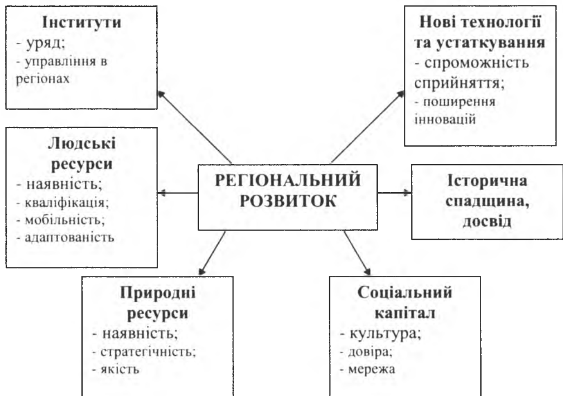
Рис. 1. Складові елементи регіонального розвитку

Головним у розвитку господарського комплексу області в подальшому повинні стати дії по нейтралізації негативних наслідків диспропорції в розвитку та розміщенні продуктивних сил, поліпшенні екологічної ситуації в місті Одеса та області, по-