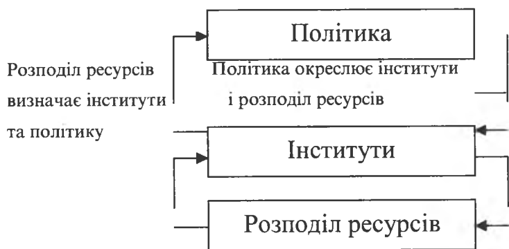
Рис. 1. Кругообіг “Політика-інститути-ресурси” [8]

Дійові особи на суспільній сцені частково грають за наявними правилами, а частково визначають ці правила. Фірми, держава і громадянське суспільство мають мож-