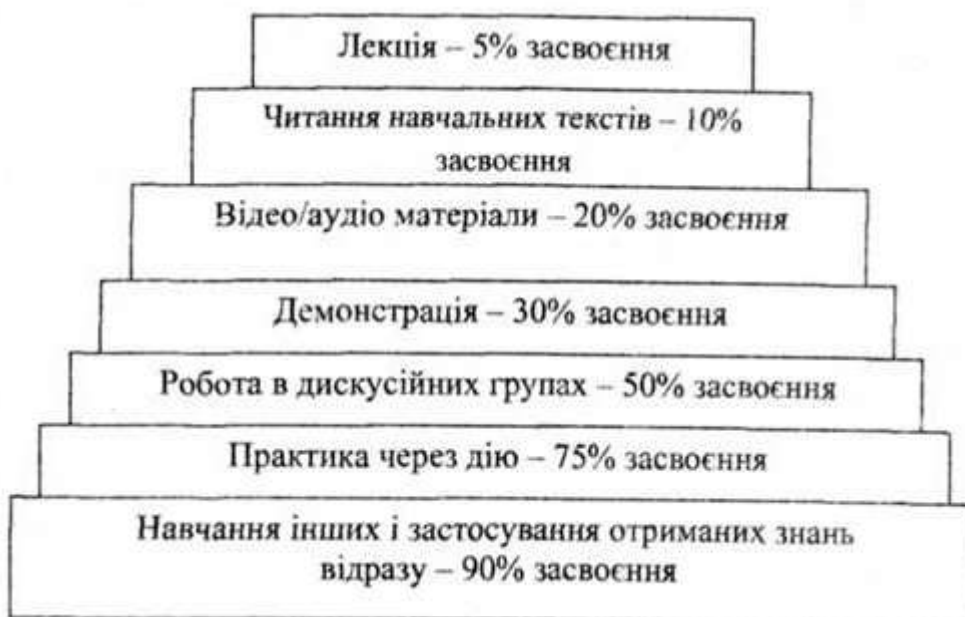
Рис. 17. Залежність якості засвоєння знань від методів навчання

Комп'ютер потребує правильного програмного забезпечення, щоб інтерпретувати дані, введені в його пам'ять. Мозок людини повинен пов'язати матеріал, що вивчається, з тим, який людина вже знає і як вона думає. Коли навчання пасивне, мозок не простежує ці зв'язки і не забезпечує повноцінного засвоєння. Нарешті, комп'ютер не може зберегти інформацію, якщо вона не оброблена і не "закріплена" за допомогою спеціальної команди. Таким же чином мозок людини повинен перевірити інформацію, узагальнити її, пояснити її комусь для того, щоб зберегти її в власній пам'яті. Коли навчання пасивне, мозок майже не зберігає раніше отриману інформацію. Отже, згадаємо слова китайського філософа - просвітителя Конфуція, сказані понад 2400 років тому: