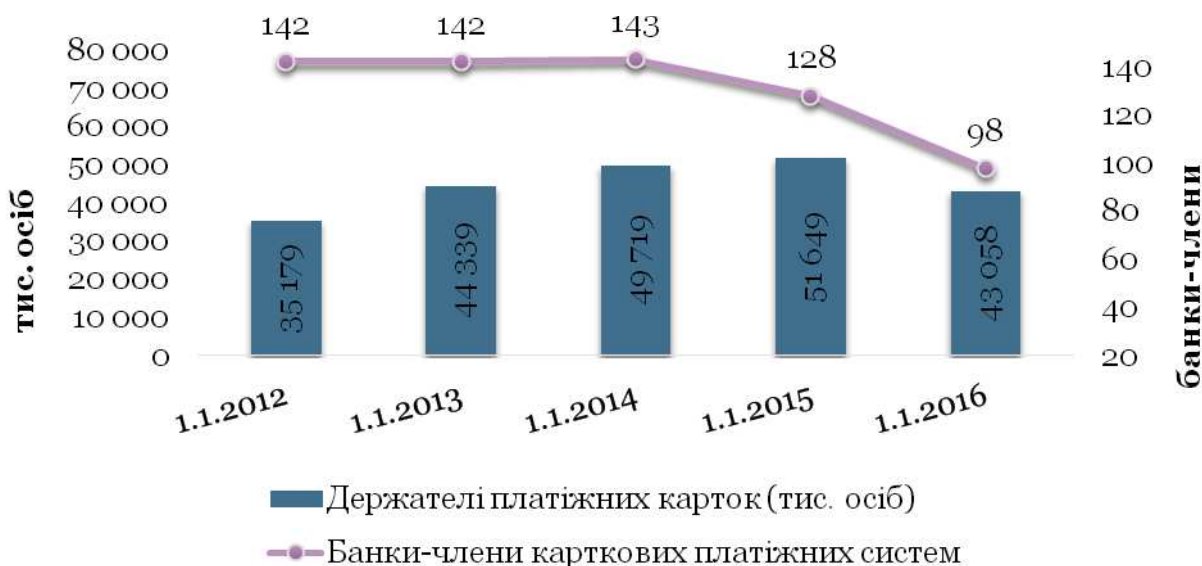
Рис.2. Кількість держателів платіжних карток і банків-членів карткових платіжних систем [5]

На 1 січня 2016 року кількість банків-членів карткових платіжних систем становила 98 (77,2% від загальної кількості), що обслуговували 43 млн. клієнтів банків (рис.2).