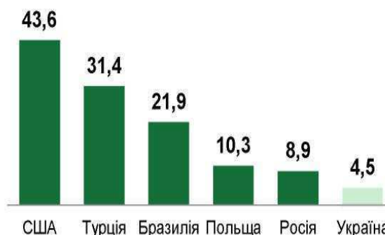
Рис.1. Інфраструктура безготівкових розрахунків в Україні та інших країнах [4]