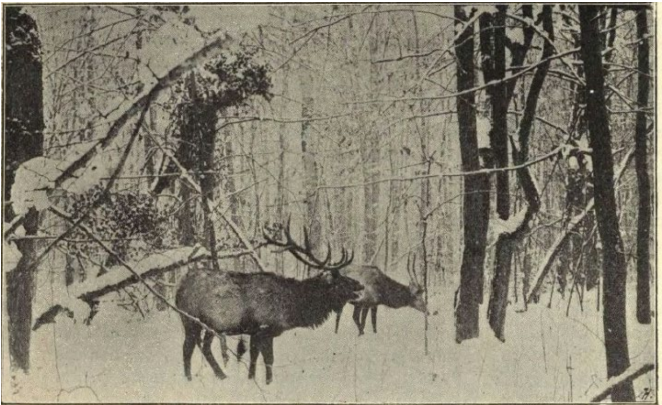
„Z Piławina“. Cervus maral Asiaticus .