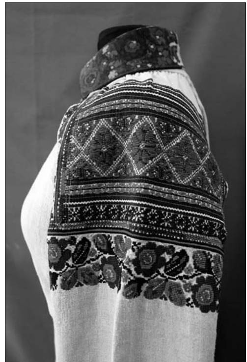
Іл. 5. Уставка і комір жіночої сорочки (фрагмент). Початок ХХ ст., с. Чертіж Жидачівського р-ну Львівської обл. (тепер Стрийський р-н Львівської обл.). МЕХП ЕП-80430

тальне наповнення — багатшим. Затухаючий доверху ритм (у напрямку коміра), натомість, був сформований більшою кількістю щораз вужчих стрічок