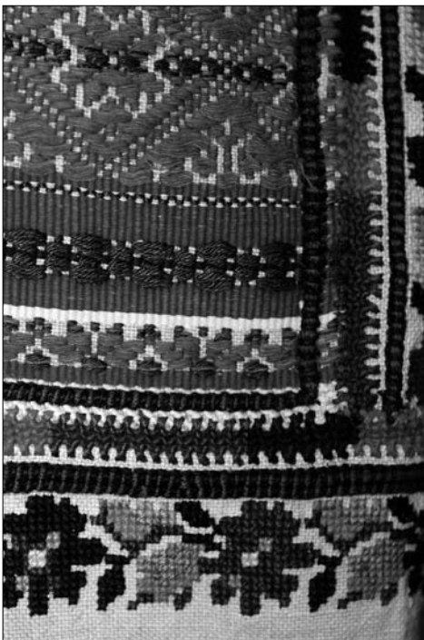
Іл. 3. Уставка жіночої сорочки (фрагмент). Початок ХХ ст., с. Чертіж Жидачівського р-ну Львівської обл. (тепер Стрийський р-н Львівської обл.). МНАП АП-9757

по лінії плеча, у вигляді прямокутної — видовженої горизонтально (20 x 19,5 см), іноді квадратної (19 x 19 см, 21 x 21 см) вставки «уставки». Вона створена техніками перетику і перебору «в перебори», «зі заборами», «на забори» [6]. Додаткові компоненти оздоблення уставок (з трьох сторін)