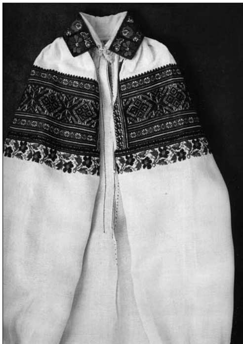
Іл. 11. Сорочка жіноча (фрагмент). 20—30-ті рр. ХХ ст., с. Збора Калуського р-ну Івано-Франківської обл. МНАП АП-11904. Вишивка Жидачівщини з колекції Музею народної архітектури та побуту ім. Климента Шептицького. Ч. 1. Львів: Артклас, 2019. С. 20