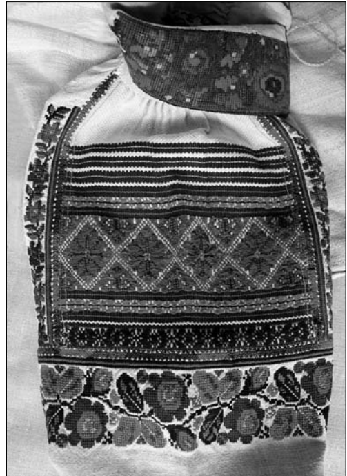
Іл. 4. Сорочка жіноча (фрагмент). Початок ХХ ст., с. Чертіж Жидачівського р-ну Львівської обл. (тепер Стрийський р-н Львівської обл.). МЕХП ЕП-80430

Якщо провести вісь симетрії по горизонталі через найширшу орнаментальну смугу уставки, то верхня і нижня її частини не були симетричними. Так, унизу кількість візерунків була меншою, а їхнє орнамен-