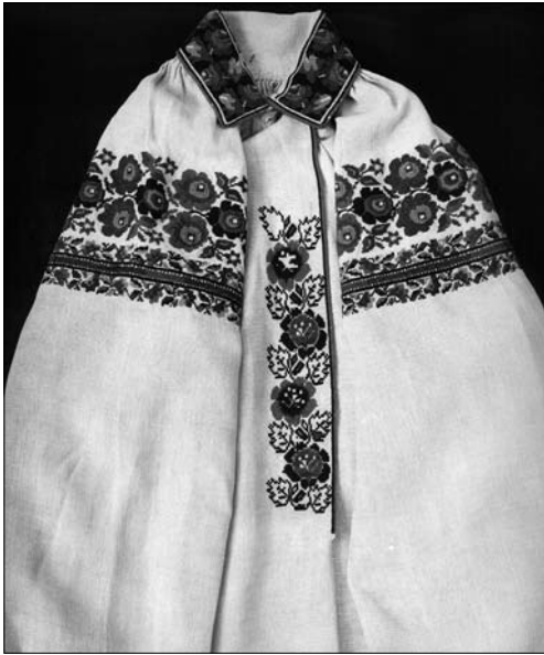
Іл. 15. Сорочка жіноча (фрагмент). Перша пол. XX ст., с. Чертіж Жидачівського р-ну Львівської обл. (тепер Стрийський р-н Львівської обл.). МНАП АП-20040. Вишивка Жидачівщини з колекції Музею народної архітектури та побуту ім. Климента Шептицького. Ч. 1. Львів: Артклас, 2019. С. 32