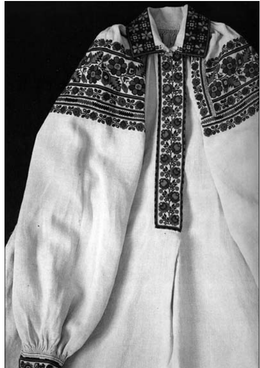
Іл. 17. Сорочка жіноча (фрагмент). Перша пол. XX ст., с. Володимирці Жидачівського р-ну Львівської обл. (тепер Стрийський р-н Львівської обл.). МНАП АП-8691. Вишивка Жидачівщини з колекції Музею народної архітектури та побуту ім. Климента Шептицького. Ч. 1. Львів: Артклас, 2019. С. 34

Загалом, за системою декорування (мотивами орнаменту, схемами їх розташування, ритмікою, кольоровою гамою) взористоткані уставки сорочок, подібні з іншими одяговими та інтер'єрними виробами