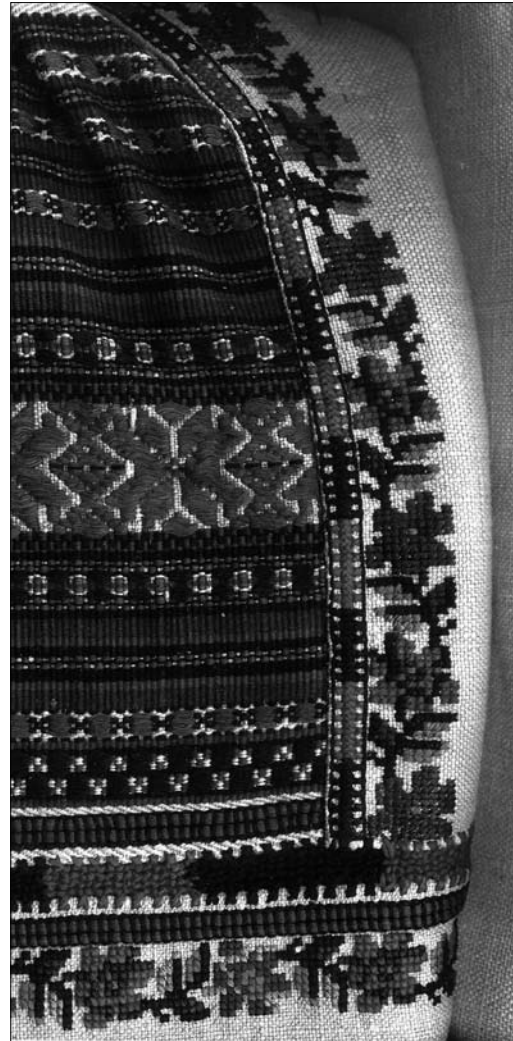
Іл. 7. Уставка жіночої сорочки (фрагмент). Початок ХХ ст., с. Чертіж Жидачівського р-ну Львівської обл. (тепер Стрийський р-н Львівської обл.). МНАП АП-9141. Вишивка Жидачівщини з колекції Музею народної архітектури та побуту ім. Климента Шептицького. Ч. 1. Львів: Артклас, 2019. С. 11

Тканий забір — центральну частину уставки інколи доповнювали вишивкою (часто хрестиком) [9]. До монохромного орнаменту, виконаного червоним, додавали синіх, зелених, жовтих та помаранчевих барв (іл. 5). У такий спосіб ущільнювали візерунок, надаючи йому більшої насиченості, наповненості кольоровими плямами та лініями. Крім того, це сприяло об'єднанню окремих елементів оздобленого плечової частини виробу (тканий забір, змережування, підуставковий вишитий візерунок) в єдину органічно цілісну композицію, яка перегукувалася