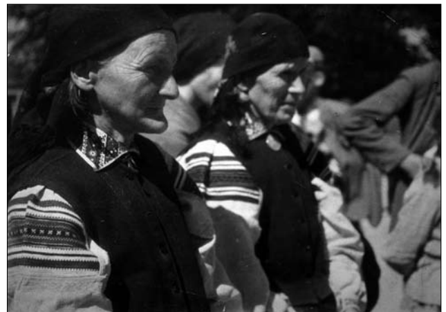
Іл. 1. Дорош Ю. Старі жінки під церквою. Перша пол. XX ст. 11245

Основна частина. Жіночі сорочки на цих теренах виготовляли з домотканого лляного «куживного», дещо рідше конопляного відбіленого полотна, за традиційним для Опілля, Волині, Полісся та інших регіонів України уставковим кроєм по пітканню. Основний узорнотканий декор у них розташований