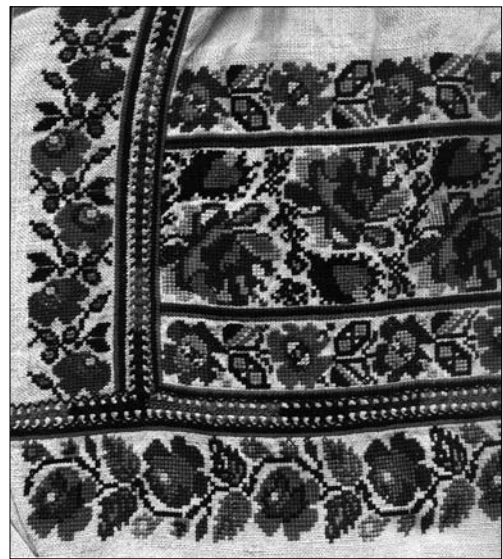
Іл. 14. Уставка жіночої сорочки (фрагмент). Перша пол. XX ст., с. Володимирці Жидачівського р-ну Львівської обл. (тепер Стрийський р-н Львівської обл.). МНАП АП-6717. Вишивка Жидачівщини з колекції Музею народної архітектури та побуту ім. Климента Шептицького. Ч. 1. Львів: Артклас, 2019. С. 30

Крім «занизування», такі більш прості орнаментальні схеми могли виконувати також хрестиком. Зразки уставок із подібним декором походять, переважно, із Калушини. Зберігаючи загальну структуру, яка відповідає тканим взірцям, — ширина смуги, схема укладання мотивів ромбів один в один, центральний з яких із гачкоподібним завершенням, — майстрині виділяли кольором (синім, червоним, жовтим) центр мотивів та основні конструктивні лінії орнаменту. Яскраві барви змінювали візерункову ритміку із розміреної на акцентну.