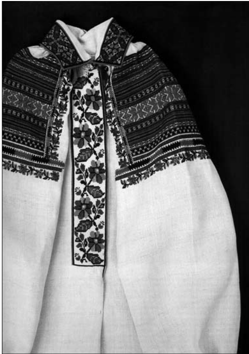
Іл. 6. Сорочка жіноча (фрагмент). Початок ХХ ст., с. Чертіж Жидачівського р-ну Львівської обл. (тепер Стрийський р-н Львівської обл.). МНАП АП-9141. Вишивка Жидачівщини з колекції Музею народної архітектури та побуту ім. Климента Шептицького. Ч. 1. Львів: Артклас, 2019. С. 10

(від 3 до 7—8) із повтором простих мотивів, або ж із чергування заповнених дрібними мотивами смуг із гладкотканими репсом елементами (іл. 4).