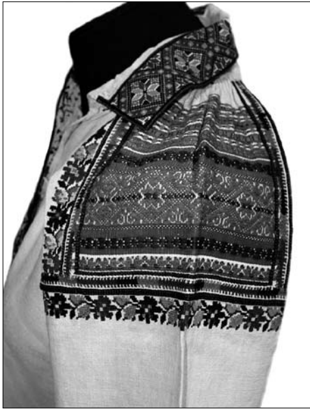
Іл. 2. Сорочка жіноча (фрагмент). Початок ХХ ст., с. Чертіж Жидачівського р-ну Львівської обл. (тепер Стрийський р-н Львівської обл.). МНАП АП-9757