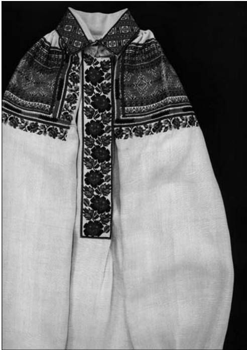
Іл. 9. Сорочка жіноча (фрагмент). Початок ХХ ст., с. Чертіж Жидачівського р-ну Львівської обл. (тепер Стрийський р-н Львівської обл.). МНАП АП-9199. Вишивка Жидачівщини з колекції Музею народної архітектури та побуту ім. Климента Шептицького. Ч. 1. Львів: Артклас, 2019. С. 16