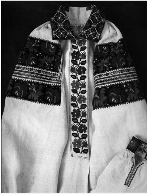
Іл. 18. Сорочка жіноча (фрагмент). Перша пол. ХХ ст., с. Подорожне Жидачівського р-ну Львівської обл. (тепер Стрийський р-н Львівської обл.). МНАП АП-6620. Вишивка Жидачівщини з колекції Музею народної архітектури та побуту ім. Климента Шептицького. Ч. 1. Львів: Артклас, 2019.

Порівнюючи вишите оздоблення жіночих сорочок в межах центрів Підгір'я відзначаємо загальну подібність жидачівських та калуських зразків із однотипними виробами зі Стрия чи Дрогобича. Проте, у цих осередках виявлено значно менше сорочок, оздоблених «заволіканням» чи «занизуванням». Домінують хрестикові візерунки Дрогобиччини більш геометризовані, аніж жидачівські чи калуські. Їх вирізняє переважання червоно-чорної гами та максимально лаконічне трактування форм, щільний уклад мотивів у смугі. Для стрийської орнаментики, натомість, притаманна більша варіативність рослинних мотивів, оздоблення уставки однією широкою смугою, дублювання візерунку уставки у підуставковій смугі.