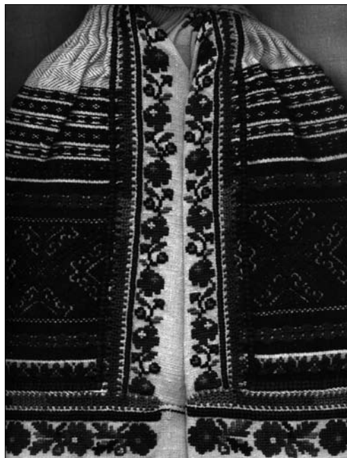
Іл. 8. Уставки жіночої сорочки (фрагмент). Початок XX ст., с. Чертіж Жидачівського р-ну Львівської обл. (тепер Стрийський р-н Львівської обл.). МНАП АП-9181. Вишивка Жидачівщини з колекції Музею народної архітектури та побуту ім. Климентія Шептицького. Ч. 1. Львів: Артклас, 2019. С. 15

Значно вибагливішим і складнішим компонентом вікінчення уставки був вишитий віночок барвистого