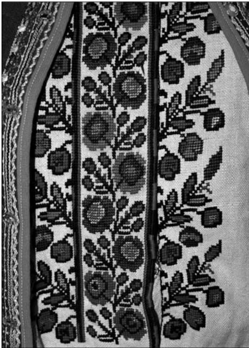
Іл. 16. Пазуха жіночої сорочки (фрагмент). Перша пол. XX ст. Жидачівщина. Постійна експозиція Львівського історичного музею

ментальних мотивів до рослинних геометризованих (згодом рослинних досить натуралістично потрактованих) та зменшення кількості вишивальних швів у одному зразку із доміантою хрестика. Складну ба-