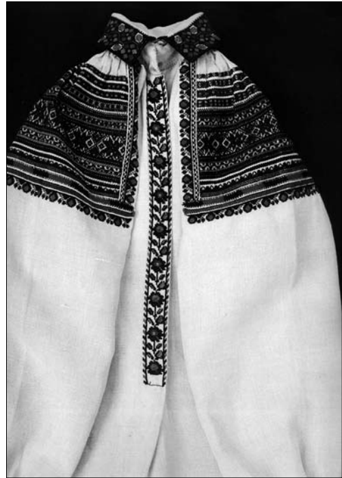
Іл. 10. Сорочка жіноча (фрагмент). Початок ХХ ст., с. Чертіж Жидачівського р-ну Львівської обл. (тепер Стрийський р-н Львівської обл.). МНАП АП-19213. Вишивка Жидачівщини з колекції Музею народної архітектури та побуту ім. Климента Шептицького. Ч. 1. Львів: Артклас, 2019. С. 18