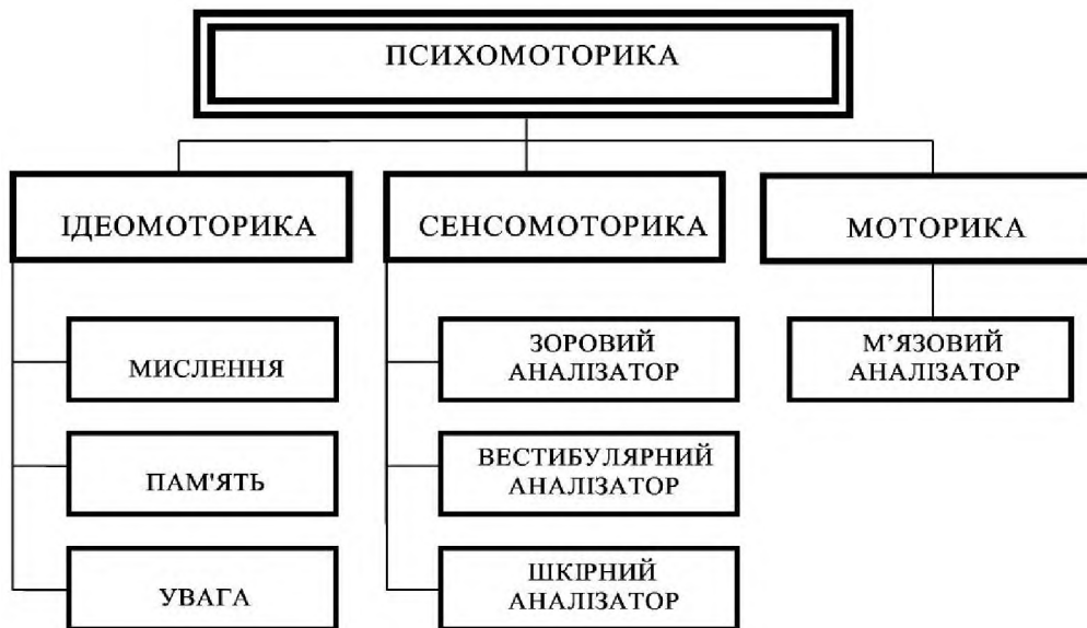
Рис. 1. Структура психомоторики

Емпіричні припущення доповнено результатами факторного аналізу, що проводився на основі даних констатувального експерименту, за якими сума внесків когнітивного та сенсорного компонентів у загальну дисперсію становить 83,8%. Визначені структурні компоненти психомоторики охоплюють усі сторони управління руховою діяльністю та вказують напрями її розвитку.