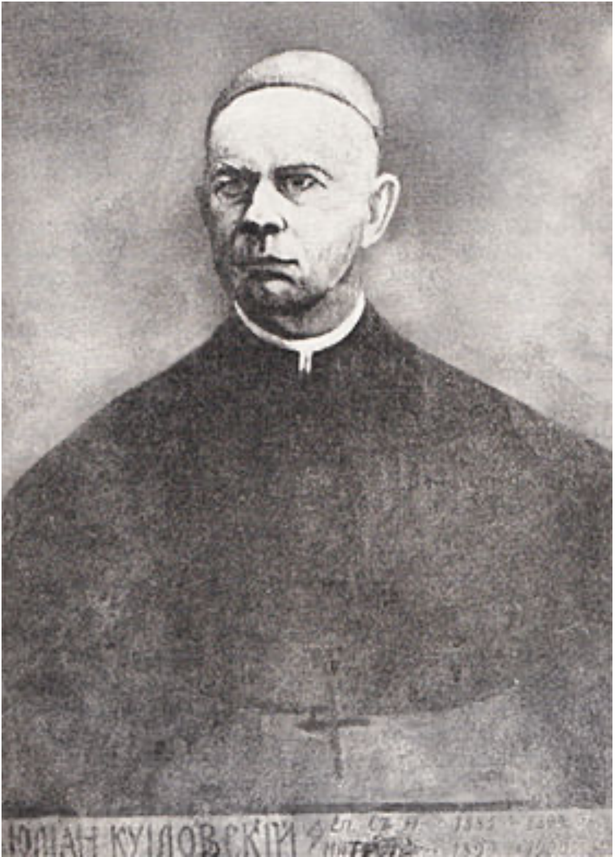
Юліан Сас-Куїловський (1891–1899)