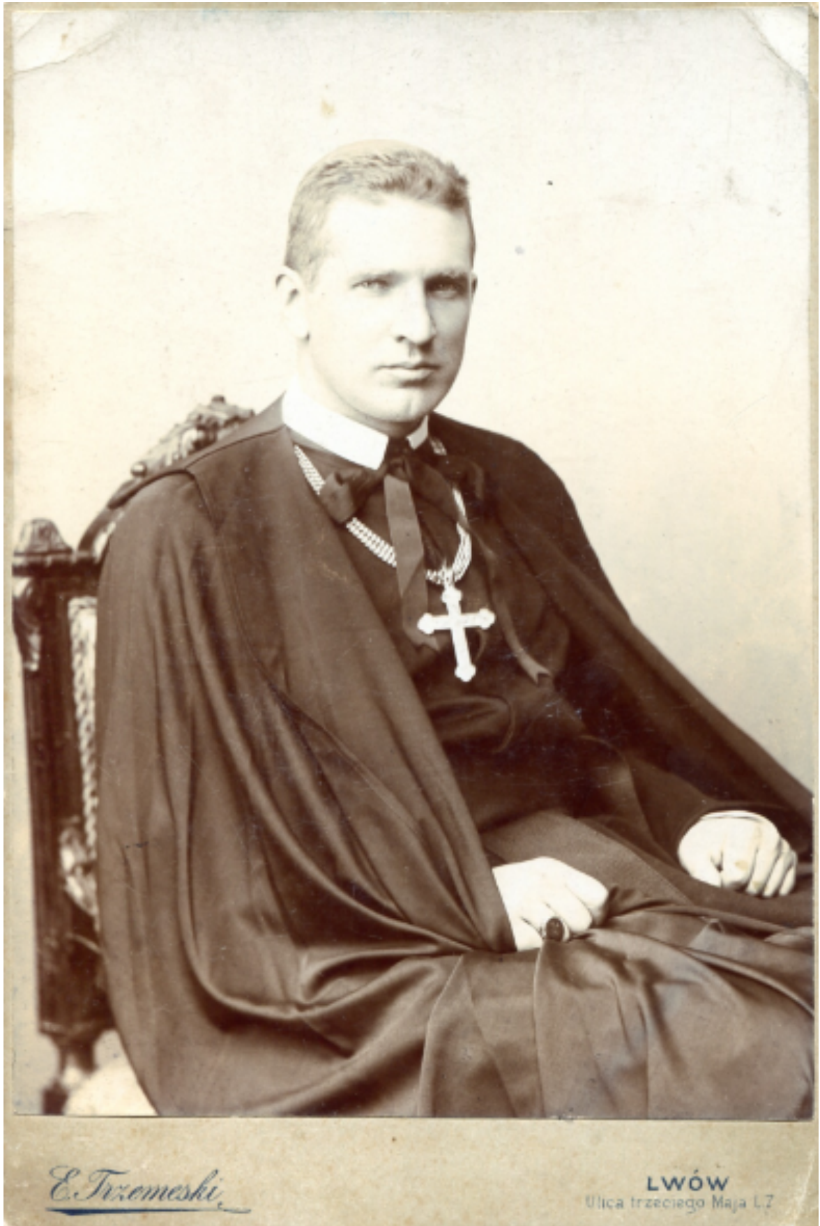
Андрей Шептицький (1899–1900)